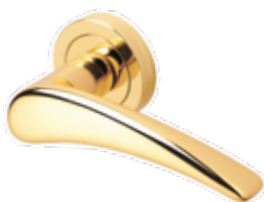
SLIM OTTONE LUCIDO