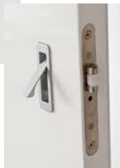
BOULEVARD LACCATO BIANCO, MANIGLIETTA TOC CROMO SATINATO