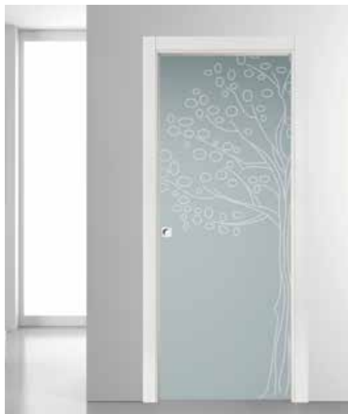
3276 VETRO SATINATO BIANCO SABBATO UNGHIATA KUADER CROMO SATINATO SCORREVOLE A SCOMPARSA