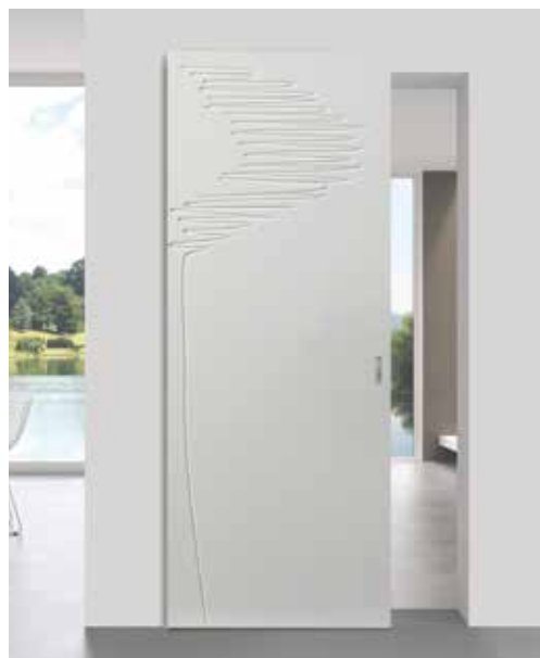
FRONDE SCORREVOLE PHANTOM, LACCATO SETA, UNGHIATA INKA CROMO SATINATO