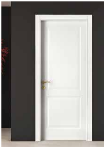
LP8 LACCATO BIANCO, TELAIO TR/L8, MANIGLIA FLY OTTONE LUCIDO