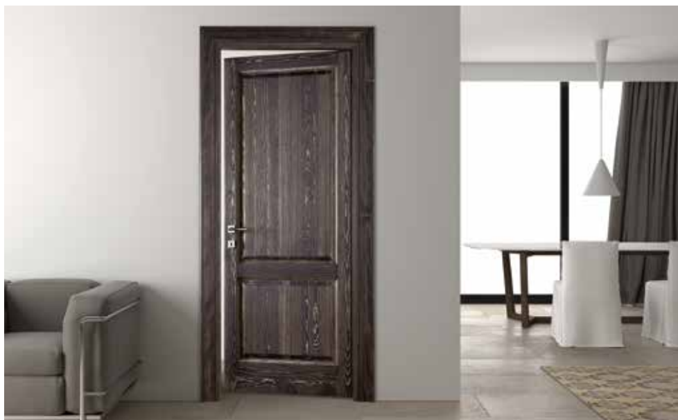
SERIE 7 P FINITURA RUSTICATA NERA, MANIGLIA TECH CROMO SATINATO