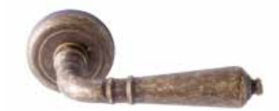
GINEVRA OTTONE VECCHIO