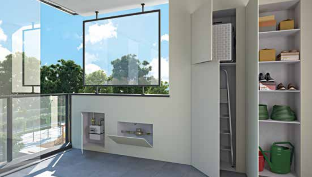
NICCHIE WALLDOOR ANTA SINGOLA