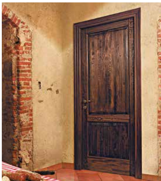
SERIE 7 P SOFTWOOD NOCE

LA COLLEZIONE DEDICATA A CHI AMA LA TRADIZIONE E GLI ARREDI DAL SAPORE ANTICO: LE LINEE CLASSICHE DELLA TRADIZIONE ARTIGIANA PIEMONTESE SONO INTERPRETATE IN PORTE DI LEGNO MASSICCIO, CON COLORAZIONI TIPICHE DELLA FALEGNAMERIA E DELLA FILIERA DEL MOBILE, IMPREZIOSITE DA TRATTAMENTI DI ANTICATURA.