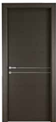
111 ALL2 GREY