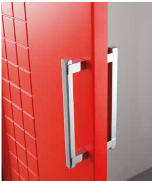
INCISA BP 1028 SCORREVOLE WALLDOOR, LACCATO ROSSO, MANIGLIONE CODA CROMO SATINATO