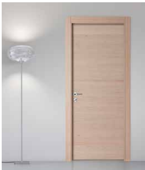
DOGA HORI CILIEGIO LIGHT, MANIGLIA NAVY CROMO SATINATO