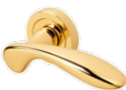
DOMUS OTTONE LUCIDO