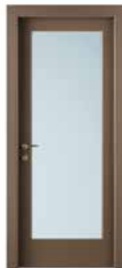
2001 V LACCATO TABACCO