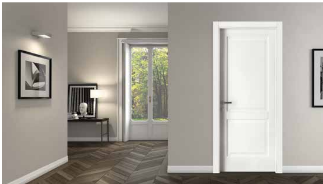
2007 P LACCATO BIANCO, MANIGLIA BILBAO CROMO SATINATO