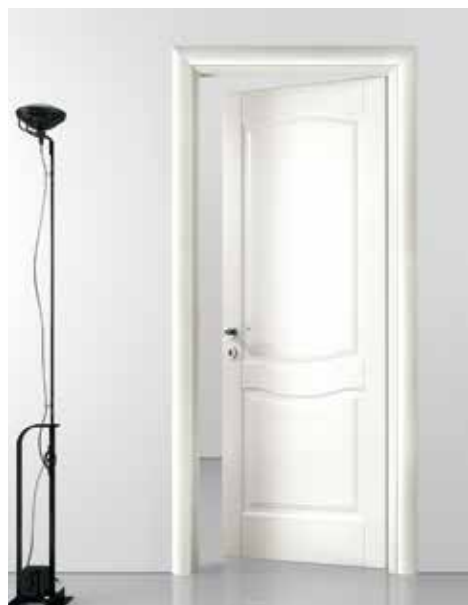
LP15 LACCATO BIANCO, TELAIO TC/R8, MANIGLIA PARROT CROMO LUC./SAT.