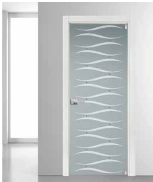
3415 VETRO SATINATO BIANCO SABBBIATO CON ACQUERELLI BOTKA 4068 MANIGLIA TIEMPO CROMO SATINATO