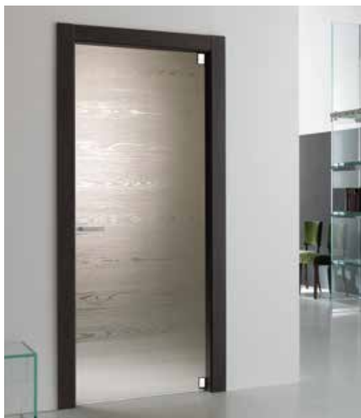
MATERIK VETRO 3701 SU BASE SATINATO BRONZO, TELAIO TSUB/LSUB69 BRUNO