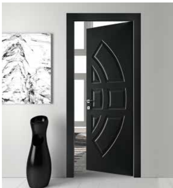
LP56 LACCATO NCS, TELAIO T/SOR+L8, MANIGLIA VERTIGO CROMO SATINATO