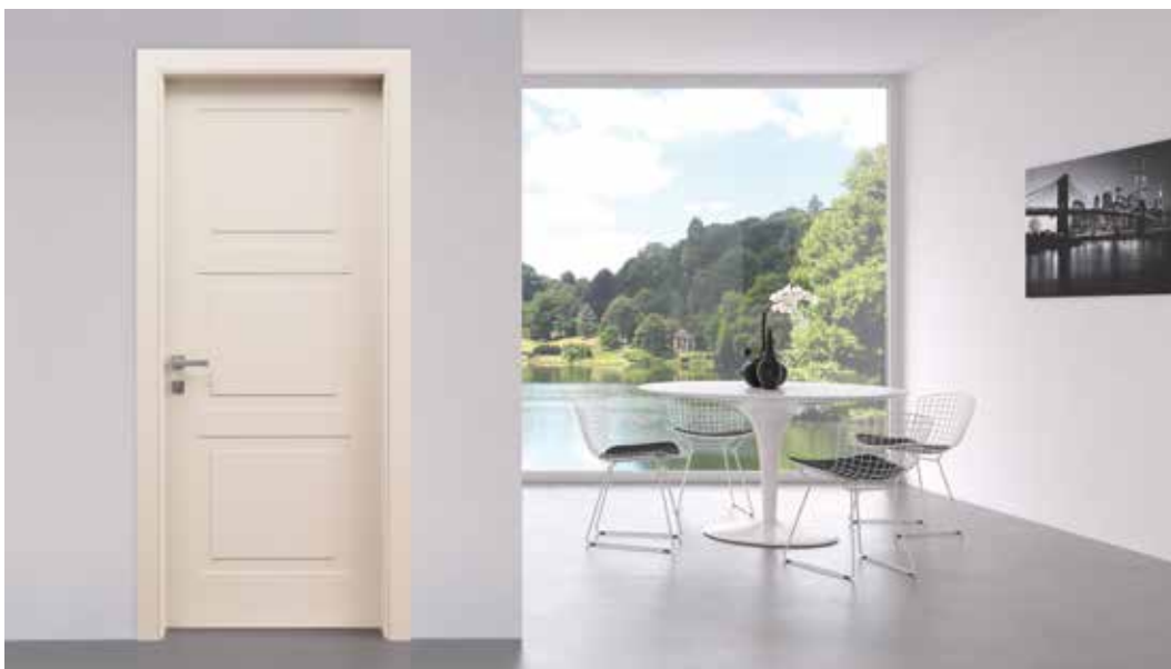
LP29 PANTOQUADRA LACCATO CIPRIA, MANIGLIA BILBAO CROMO SATINATO