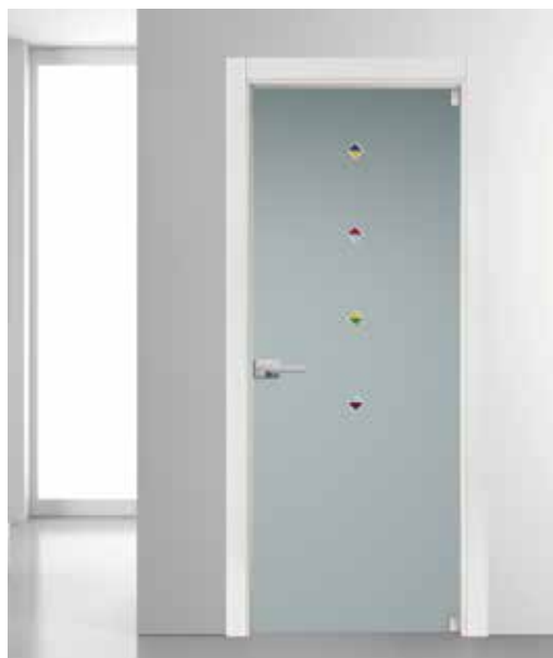
3313 VETRO SATINATO BIANCO CON ACQUERELLI MARINER MANIGLIA TIEMPO CROMO SATINATO