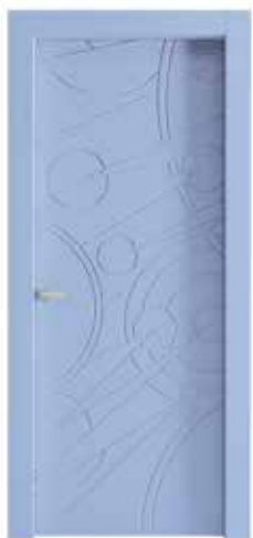
ANDROMEDA LACCATO NCS PANTONE SERENITY COLORE DELL'ANNO 2016