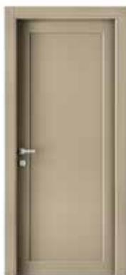
2020 P LACCATO TORTORA