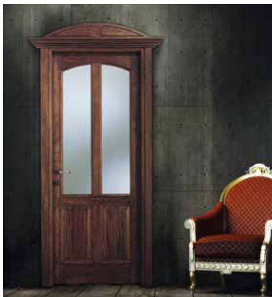
SERIE 4CE V SOFTWOOD NOCE, CAPITELLO VOLUTA CON INCISIONE