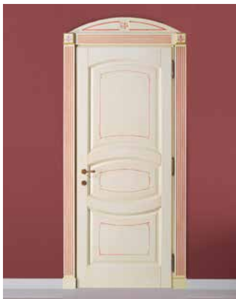
SERIE 14 P LACCATO PATINATO AVORIO, COPRIFILI DORICO , DIPINTO GIULIA