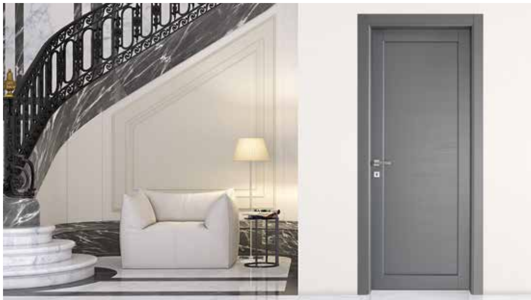
2020 P LACCATO QUARZO, MANIGLIA BILBAO CROMO SATINATO