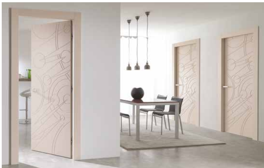
ANDROMEDA LACCATO NCS, TELAIO T/SOR, MANIGLIA BILBAO CROMO SATINATO