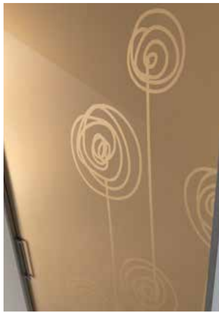
PLANA LUXOR , MODELLO FREE, PROFILO ARGENTO, VETRO REFLEX SATINATO BRONZO SABBIAATO 3245