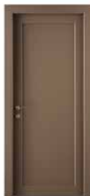
2020 P LACCATO TABACCO