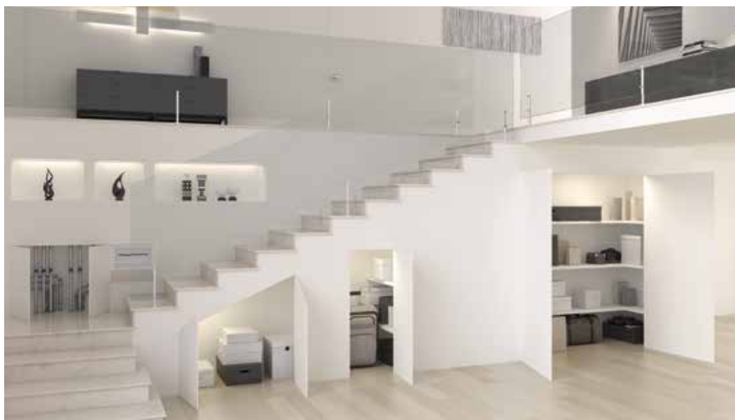
NICCHIE WALLDOOR ANTA DOPPIA E SINGOLA