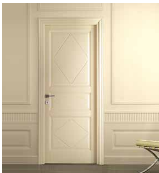
SERIE 3 P ROMBI LACCATO AVORIO, MANIGLIA CAROL CROMO SATINATO