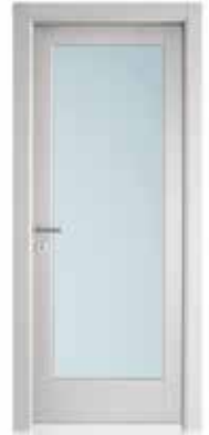
2001 V LACCATO SETA