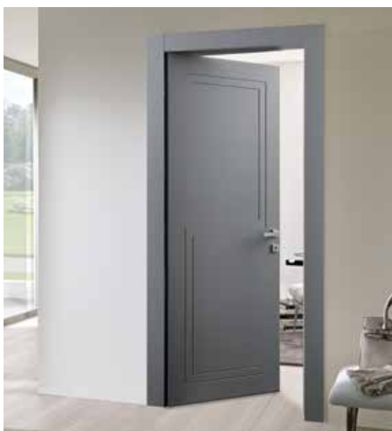
INCISA BP 1006 REVERSA, LACCATO QUARZO, TELAIO T/REV, MANIGLIA BILBAO CROMO SATINATO