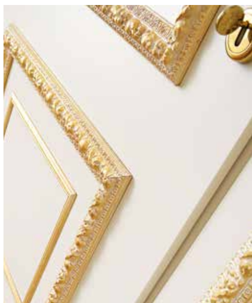
PARTICOLARI ALLESTIMENTO CORNICI ULTRA CLASSIC ORO PATINATO BIANCO