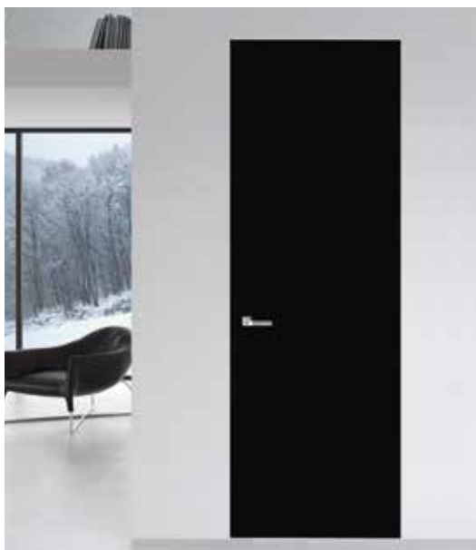
PORTA WALLDOOR CL LACCATO RAL MANIGLIA NAVY LINE CROMO SATINATO