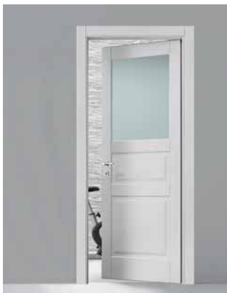
PV28 LACCATO SETA, VETRO A INFILARE SAT.BLU TELAIO TR/L8, MANIGLIA CAROL CROMO SATINATO