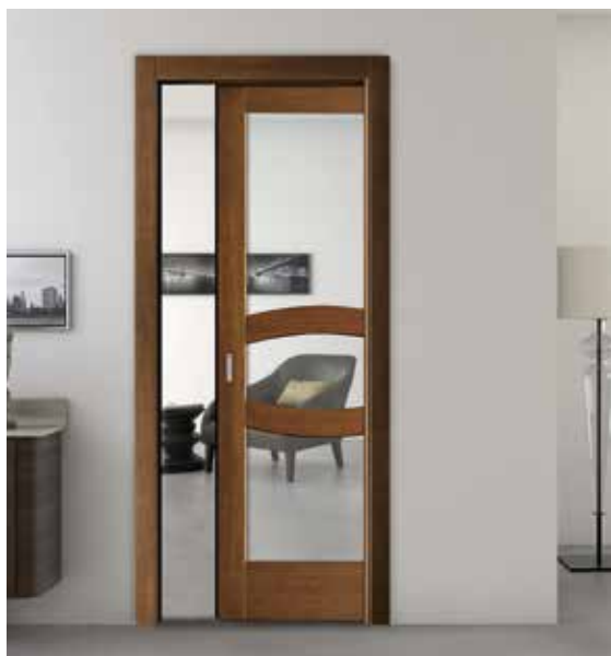
2017 V SCORREVOLE A SCOMPARSA, ROVERE NOCE, VETRO TRASPARENTE, UNGHIATA INKA CROMO SATINATO