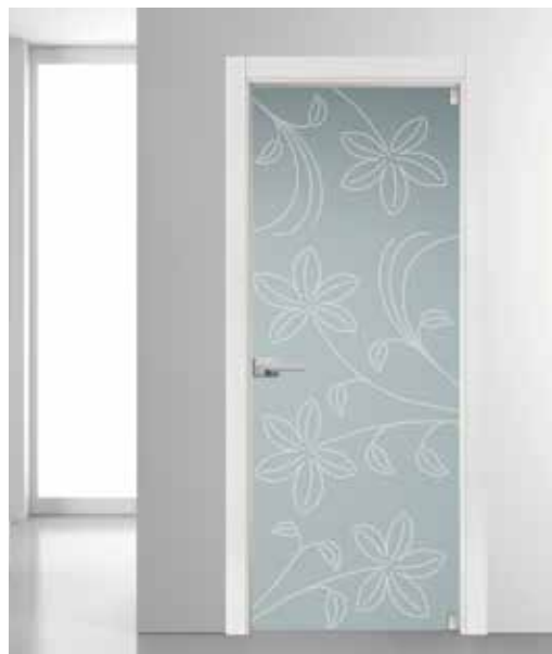
3273 VETRO SATINATO GRIGIO SABBATO MANIGLIA TIEMPO CROMO SATINATO