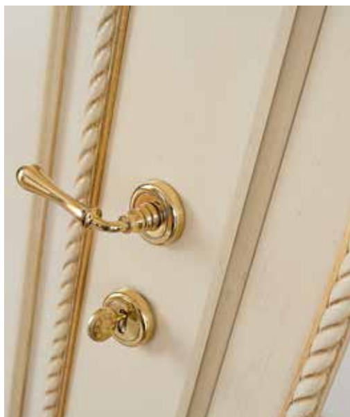
GP1 LIBERTY LACCATO AVORIO INVECCHIATO CON PANNELLO BIANCO INVECCHIATO, CORNICE ANTICATO OLIO OCRA, 3 FLOWER, MANIGLIA ANTARES OTTONE LUCIDO