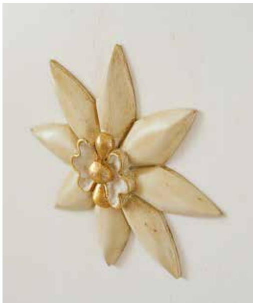
GP1 LIBERTY LACCATO AVORIO INVECCHIATO CON PANNELLO BIANCO INVECCHIATO, CORNICE ANTICATO OLIO OCRA, 2 FLOWER, COPRIFILO DECORATIVO FLAT, MANIGLIA ANTARES OTTONE LUCIDO