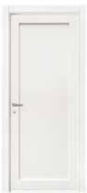
2020 P LACCATO BIANCO