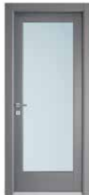
2001 V LACCATO QUARZO