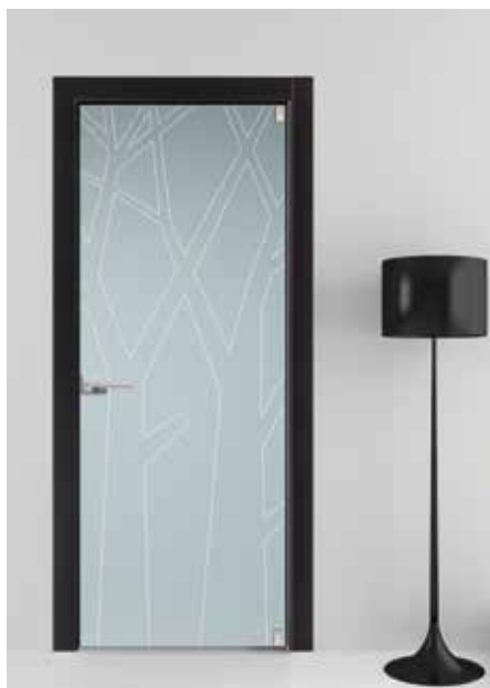
3145 LACCATO RAL, VETRO SATINATO INCISO, MANIGLIA TIEMPO CROMO SATINATO