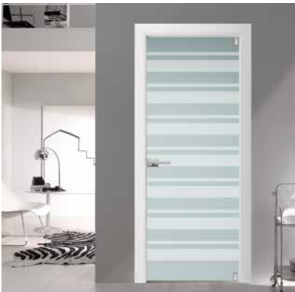
3225 VETRO SATINATO BIANCO SABBATO, TELAIO LACCATO BIANCO, MANIGLIA TIEMPO CROMO SATINATO