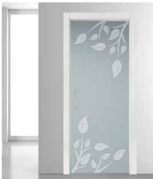
3268 SCORREVOLE A SCOMPARSA, VETRO SATINATO BIANCO SABBBIATO, MANIGLIONE CODA CROMO SATINATO