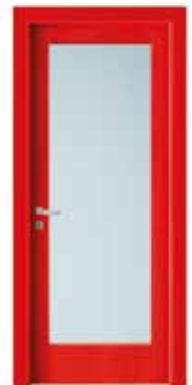
2001 V LACCATO ROSSO