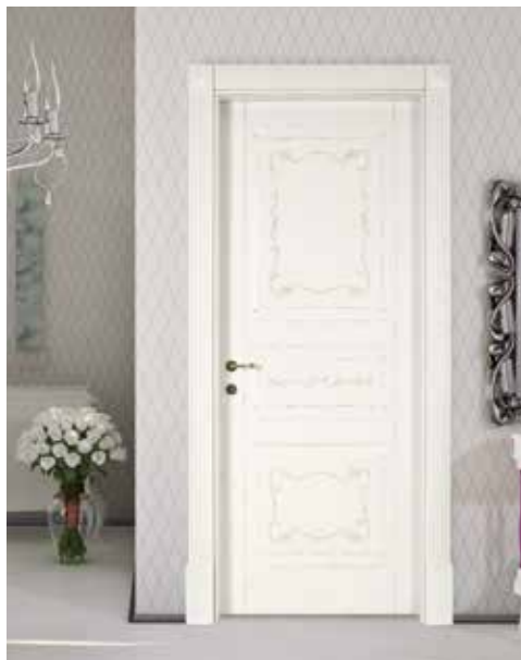
LP28 DIPINTA A MANO, LACCATO PATINATO BIANCO, MANIGLIA ANTARES OTTONE LUCIDO, DIPINTO CHIARA