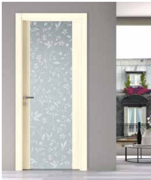
SELESTA 3260 VETRO SATINATO SABBIATO BIANCO, LACCATO AVORIO, MANIGLIA BILBAO CROMO SATINATO