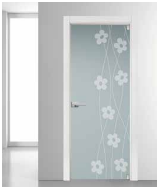
3267 VETRO SATINATO GRIGIO SABBBIATO MANIGLIA TIEMPO CROMO SATINATO