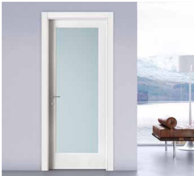
2001 V LACCATO BIANCO, MANIGLIA CAROL CROMO SATINATO