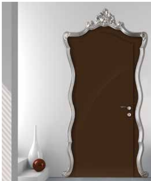
CHAPEAU LACCATO LUCIDO NCS, CORNICE ARGENTO, MANIGLIA HELIOS LUX CROMO LUCIDO