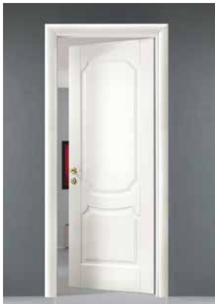
LP17 LACCATO BIANCO, TELAIO TR/R8, MANIGLIA ARMONY OTTONE LUCIDO