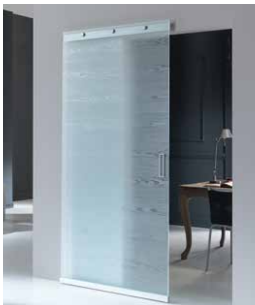
MATERIK VETRO 3701 SU BASE TRASPARENTE, SCORREVOLE PHANTOM, MANIGLIETTA SLIDE