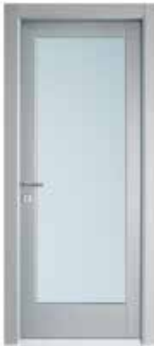
2001 V LACCATO ACCIAIO