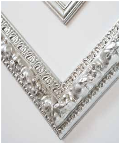
GP9 ULTRA CLASSIC LACCATO BIANCO, CORNICI FOGLIA ARGENTO OMBRATO, MANIGLIA BILBAO CROMO LUCIDO