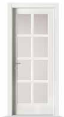
2001 F8 LACCATO BIANCO