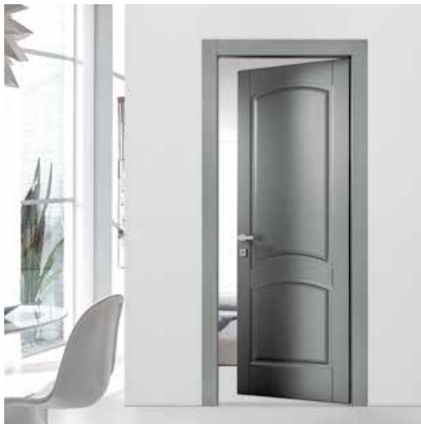
LP20 LACCATO PELTRO, TELAIO T/SOR+L8, MANIGLIA BIBLO CROMO SATINATO