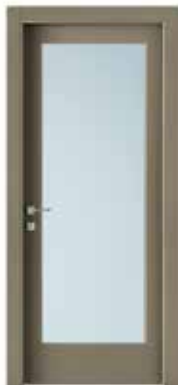
2001 V LACCATO CACAO