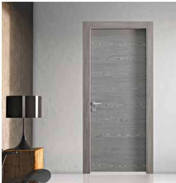
MATERIK ANICE, TELAIO TSUB/LSUB69, MANIGLIA BILBAO CROMO SATINATO