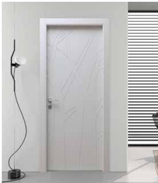
AVENUE LACCATO SETA, MANIGLIA BILBAO CROMO SATINATO