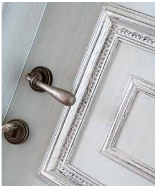
MANIGLIA ANTARES ARGENTO VECCHIO