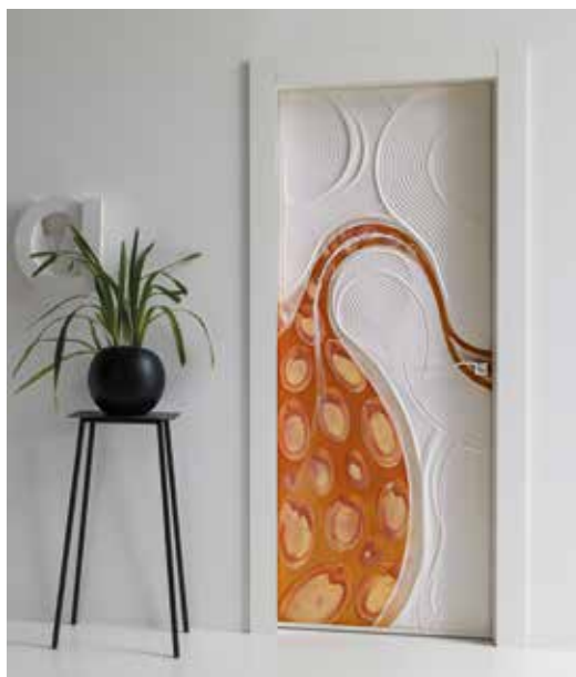
RUB TELAIO T/SOR LACCATO BIANCO, MANIGLIA PARROT CROMO LUCIDO/SATINATO