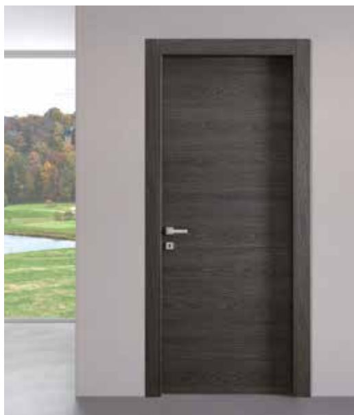
MATERIK BRUNO, TELAIO TSUB/LSUB69, MANIGLIA BILBAO CROMO SATINATO

Resistenza al graffio UNI 9428 Valore di resistenza al graffio = 5 VALORE MASSIMO RAGGIUNTO