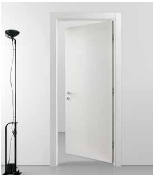
CL SKY LACCATO PORO APERTO BIANCO, MANIGLIA VIRGOLA CROMO SATINATO