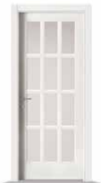
2001 F12 LACCATO BIANCO