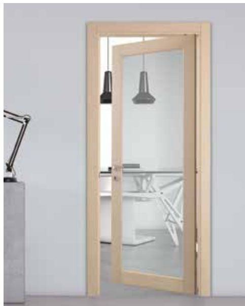
2020 V BIDIREZIONALE ROVERE SBIANCATO, VETRO TRASPARENTE, MANIGLIA NAVY LINE CROMO SATINATO