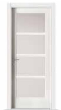
2001 F4 LACCATO BIANCO