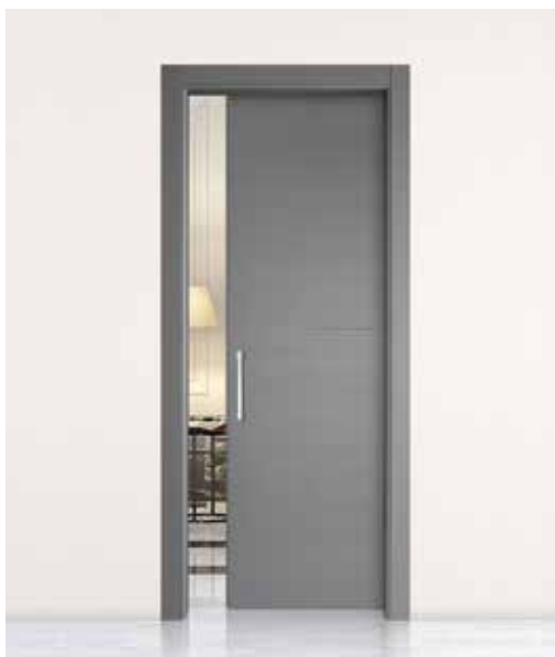
DOGA HORI SCORREVOLE INTERNO MURO, ROVERE PORO APERTO LACCATO QUARZO, MANIGLIONE CODA CROMO SATINATO