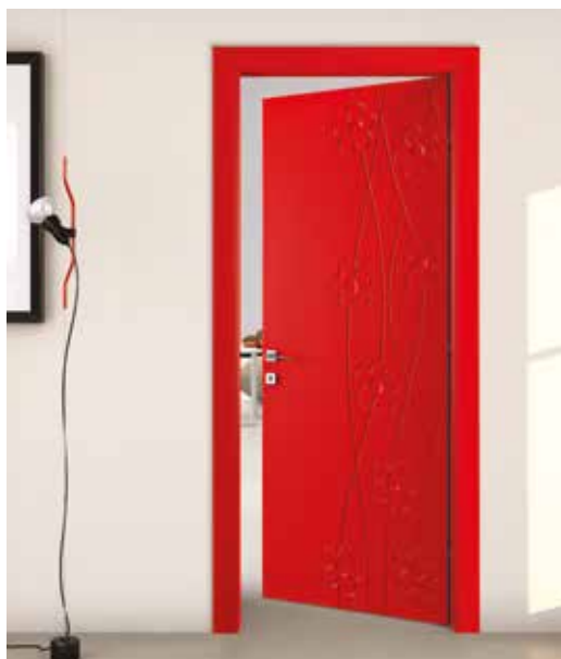
CROCUS LACCATO ROSSO, MANIGLIA TECH CROMO SATINATO