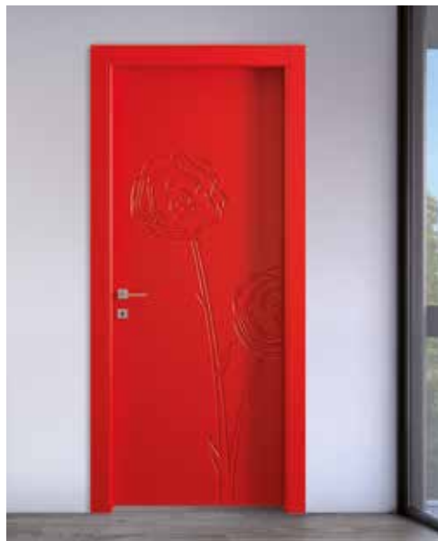
BOUQUET LACCATO ROSSO, MANIGLIA TECH CROMO SATINATO