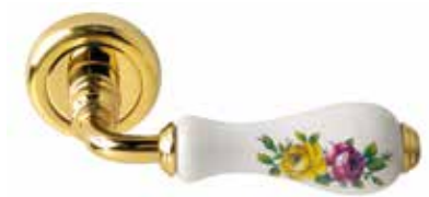
SPIGA FIORATA OTTONE LUCIDO CON CERAMICA BIANCA