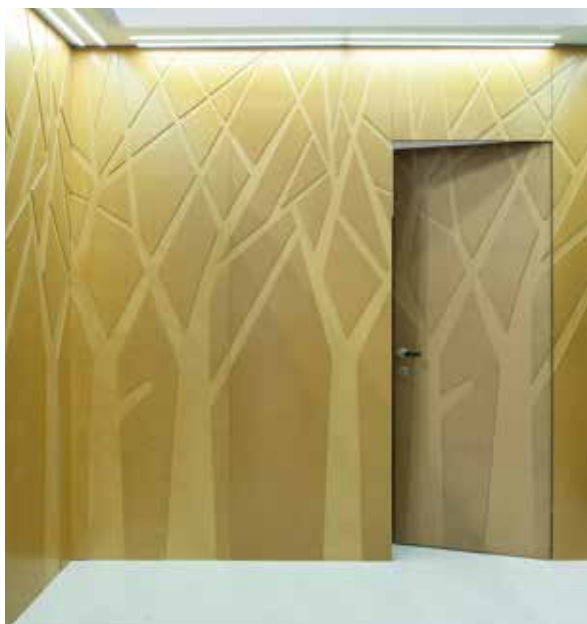
BOULEVARD MDF PARETE CON PORTA WALLDOOR