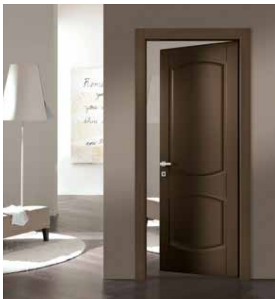
LP19 LACCATO RAL, TELAIO TR/L8, MANIGLIA BIBLO CROMO SATINATO