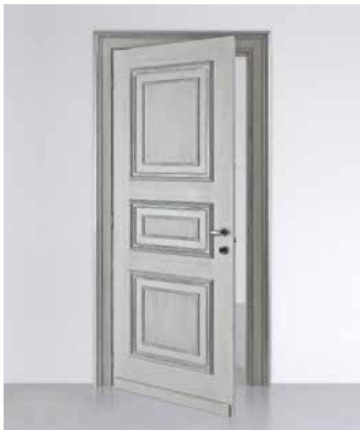
GP28 ELEGANCE GRIGIO PATINATO, CORNICE ARGENTO ANTICATO, MANIGLIA BELGRADO ARGENTO VECCHIO