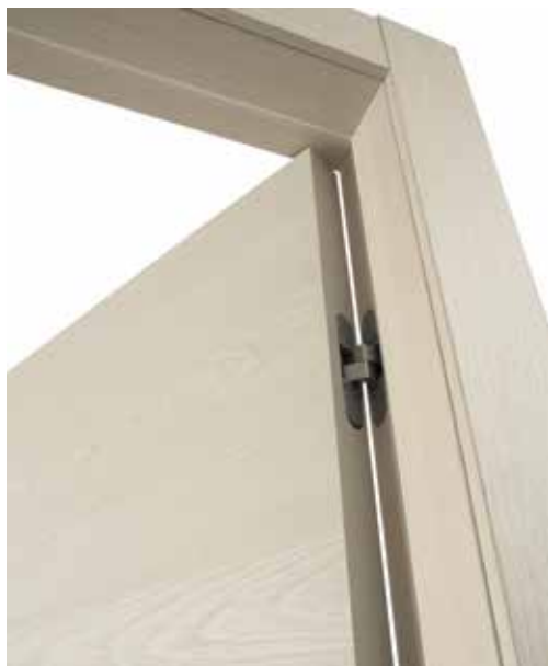
MATERIK VANIGLIA, TELAIO TSUB/LSUB69, MANIGLIA BILBAO CROMO SATINATO

TSUB È IL TELAIO OFFERTO DI SERIE SUI PRODOTTI MATERIK.