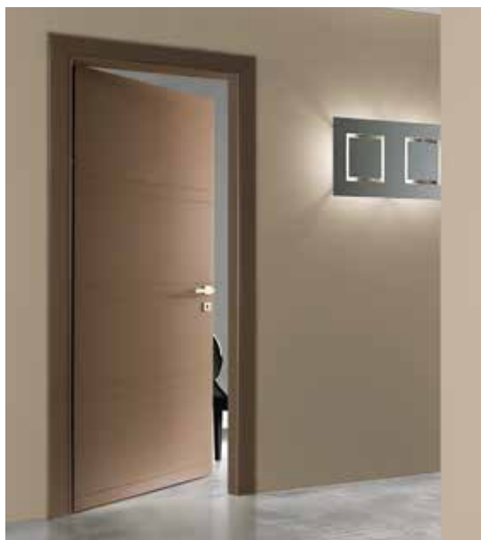
INCISA BP 1036 LACCATO TABACCO, MANIGLIA BILBAO CROMO SATINATO