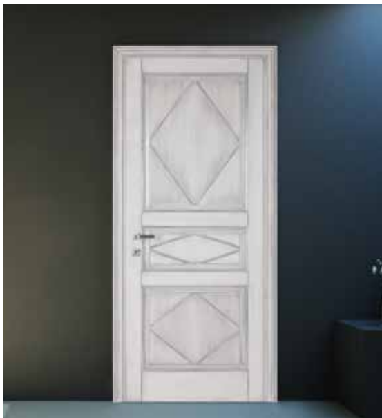
SERIE 3P CON INCISIONI ROMBI , LACCATO PATINATO GRIGIO SU BIANCO, MANIGLIA BILBAO CROMO SATINATO