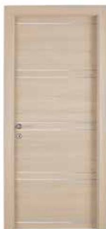
111 ALL8 LARICE