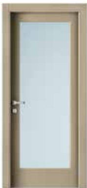
2001 V LACCATO TORTORA