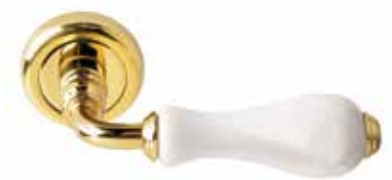
SPIGA OTTONE LUCIDO CON CERAMICA BIANCA