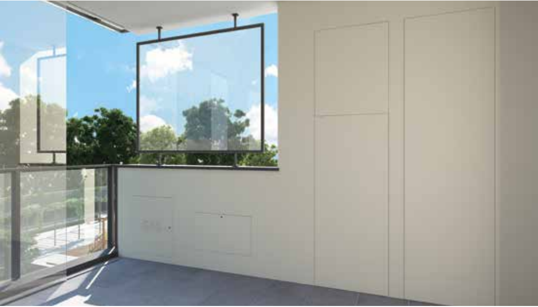
NICCHIE WALLDOOR ANTA SINGOLA