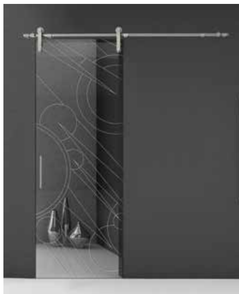
3153 , SCORREVOLE STEEL, VETRO TRASPARENTE, MANIGLIONE LINEAR CROMO SATINATO