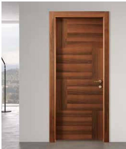
ALTERNA NOCE NAZIONALE, MANIGLIA FUTURA OTTONE LUCIDO