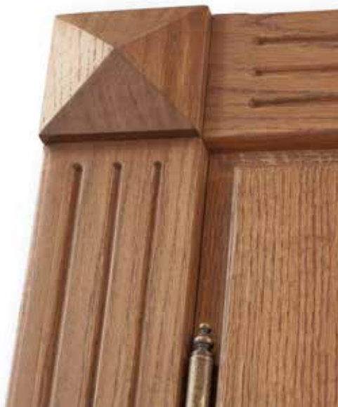
COPRIFILI DECORATIVI DORICO 3 CON TOZZETTO PIRAMIDALE