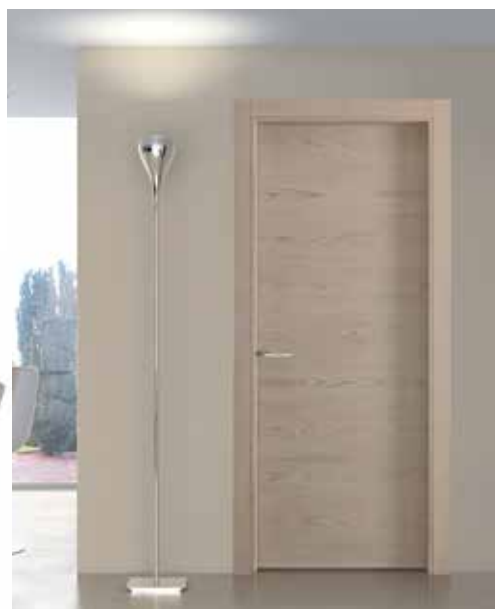
MATERIK NOCCIOLA, TELAIO TSUB/LSUB69, MANIGLIA BILBAO CROMO SATINATO