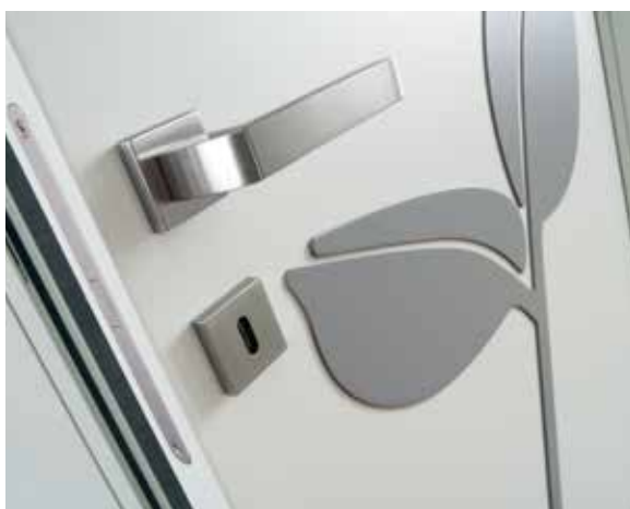
RAMO LACCATO SETA, DECORO 3D LACCATO QUARZO, TELAIO T/SOR +L8, MANIGLIA NAVY CROMO LUCIDO