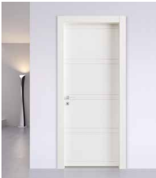
INCISA BP 1036 LACCATO BIANCO, TELAIO T/SOR+L8, MANIGLIA CAROL CROMO SATINATO