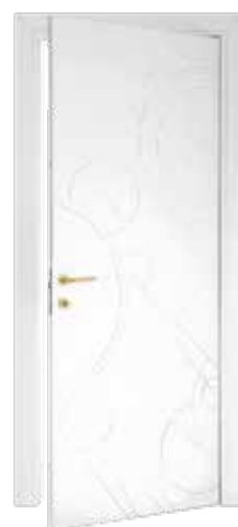
AURIGA LACCATO BIANCO