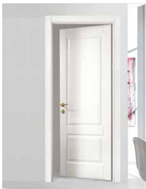
LP7 LACCATO BIANCO, TELAIO TR/L8, MANIGLIA FLY OTTONE LUCIDO