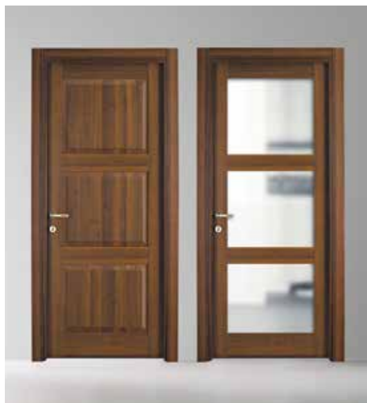
204 P NOCE NAZIONALE