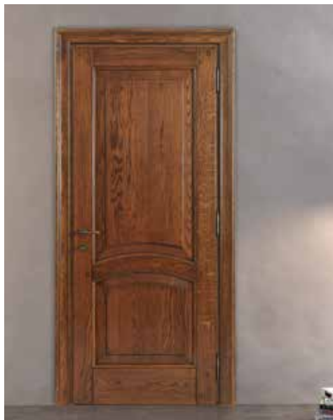
SERIE 16 P ROVERE ANTICO