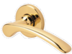
PELICAN OTTONE LUCIDO