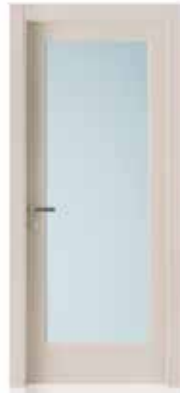
2001 V LACCATO SABBIA