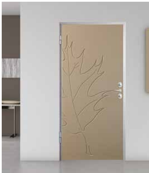
TITANO CS , RIVESTIMENTO INTERNO FOGLIA, LACCATO TORTORA, TELAIO E CARTER FINITURA SILVER, MANIGLIERIA CROMO SATINATO