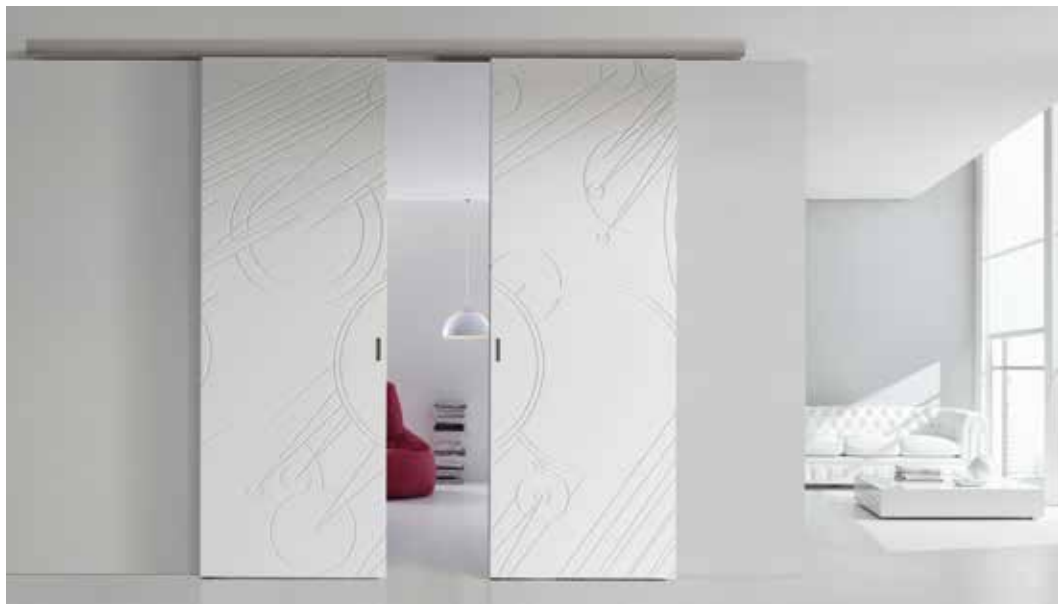
AURIGA INDIVIDUAL SCORREVOLE PLANA INCASSATO A SOFFITTO, DOPPIO BATTENTE, LACCATO BIANCO, UNGHIATA INKA CROMO SATINATO