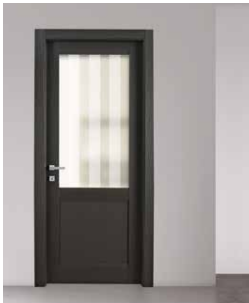
102V GREY , VETRO 3203 SATINATO BIANCO SABBIATO, MANIGLIA BIBLO CROMO SATINATO