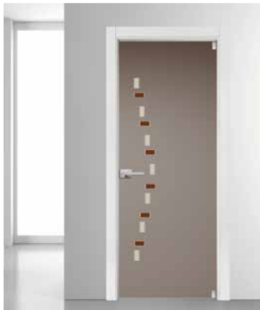
3302 VETRO SATINATO BRONZO CON ACQUERELLI DOPPIA 1007, 7228 MANIGLIA TIEMPO CROMO SATINATO