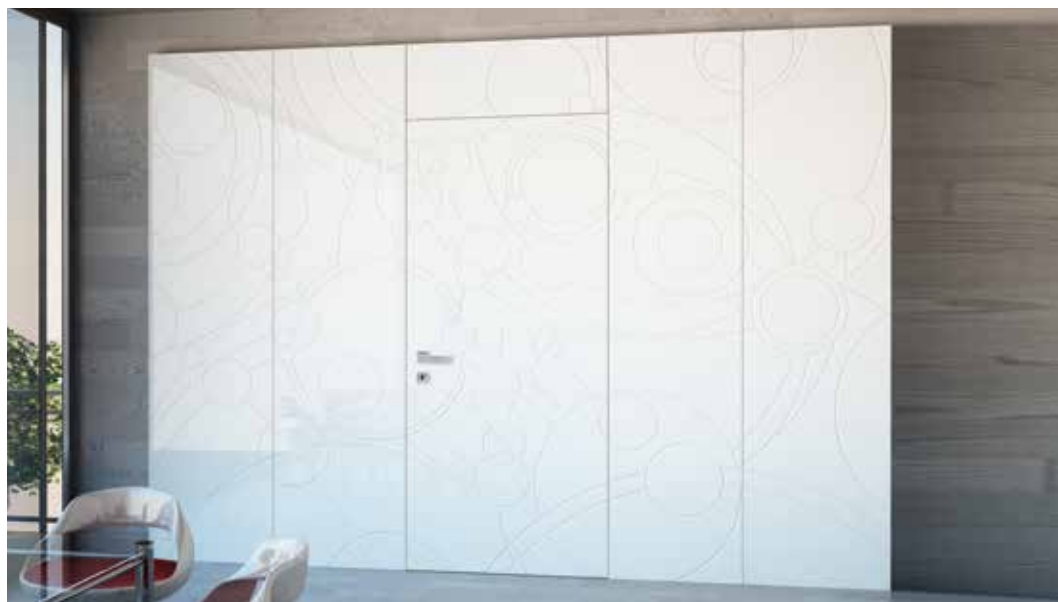
ALTAIR PROGETTO INDIVIDUAL, LACCATO BIANCO LUCIDO, MANIGLIA BILBAO CROMO SATINATO