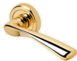
TORSION OTTONE LUCIDO