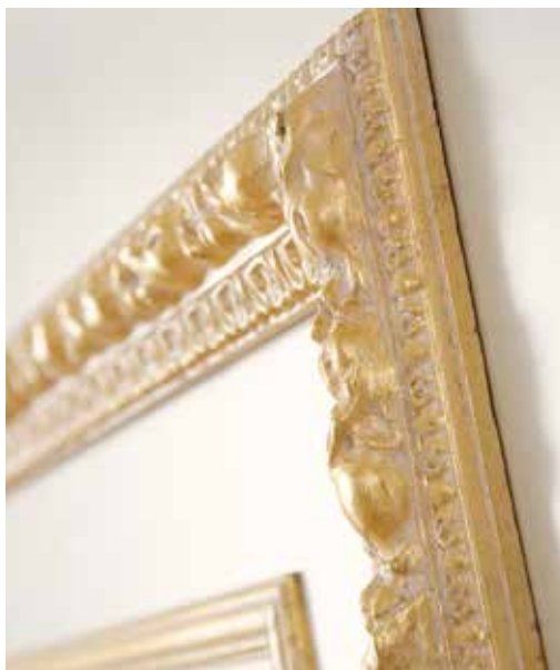
GP29 ULTRA CLASSIC LACCATO AVORIO, CORNICI ORO PATINATO BIANCO, MANIGLIA SPIGA FIORATA OTTONE LUCIDO