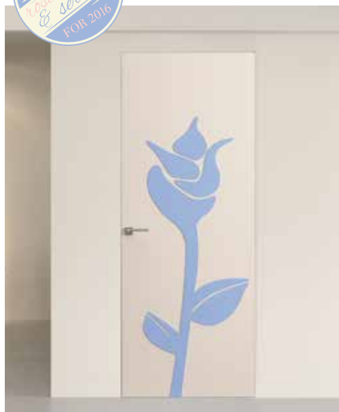
BOCCIOLIO WALLDOOR, LACCATO CIPRIA, DECORO 3D LACCATO NCS