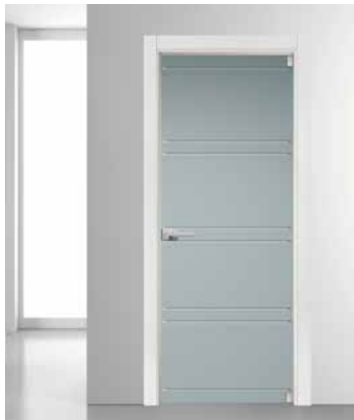
3130 VETRO SATINATO BIANCO INCISO MANIGLIA TIEMPO CROMO SATINATO