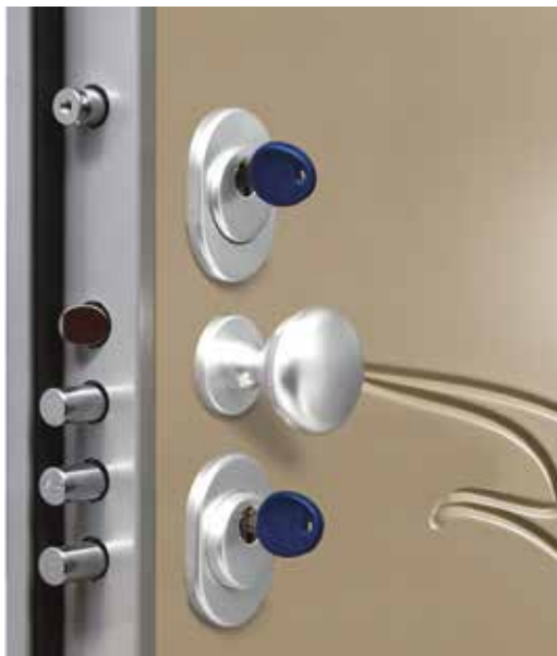
TITANO CS PLUS , TELAIO E CARTER FINITURA SILVER