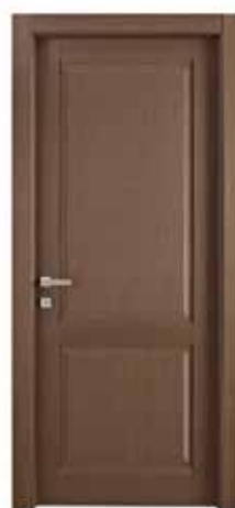
102 V ROVERE