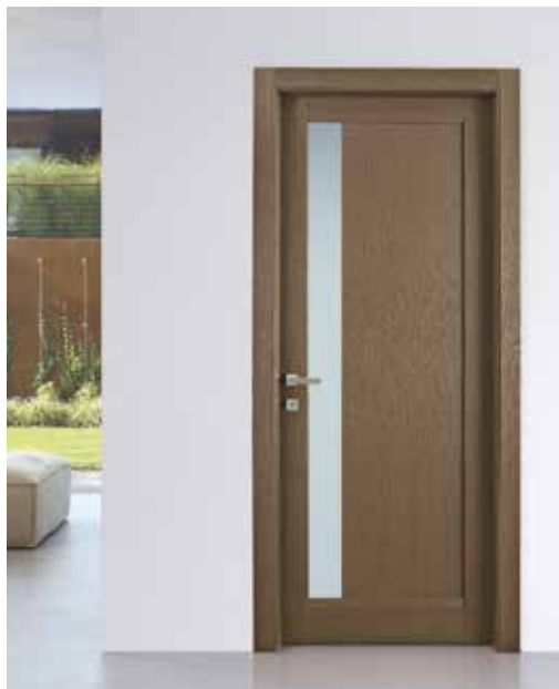
136 ROVERE , MANIGLIA BILBAO CROMO SATINATO