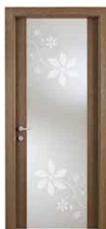
SELESTA 3202 ROVERE