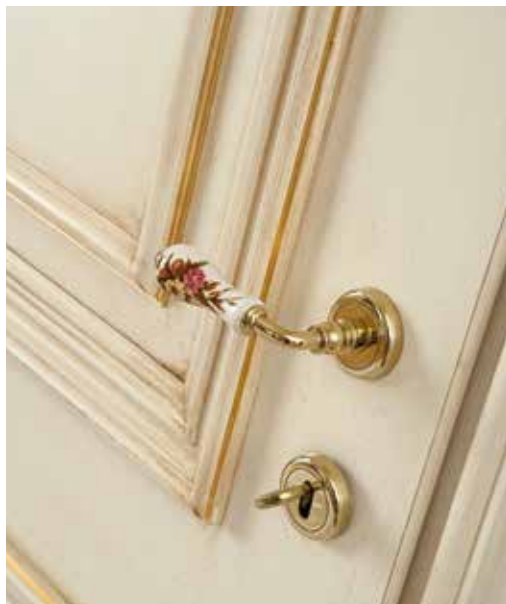
GP8 PALLADIO LACCATO PATINATO AVORIO ANTICO OLIO, CORNICI FILO ORO, MANIGLIA SPIGA FIORATA OTTONE LUCIDO