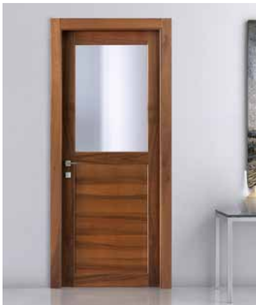
2024 V NOCE NAZIONALE, VETRO SATINATO BIANCO, MANIGLIA CAROL CROMO SATINATO