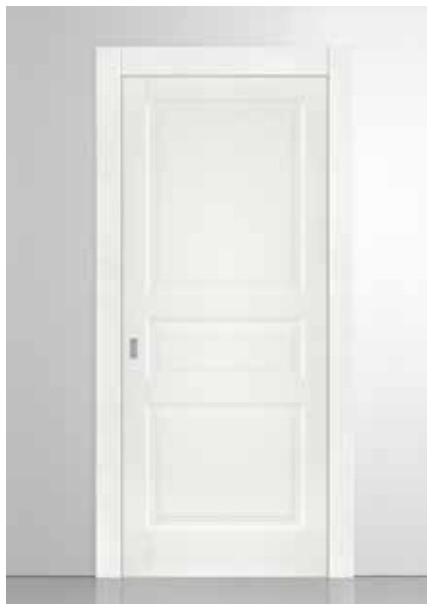
LP28 LACCATO BIANCO, TELAIO TR/REV+L8, MANIGLIA TOC CROMO SATINATO