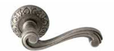
RETRO' FERRO ANTICO