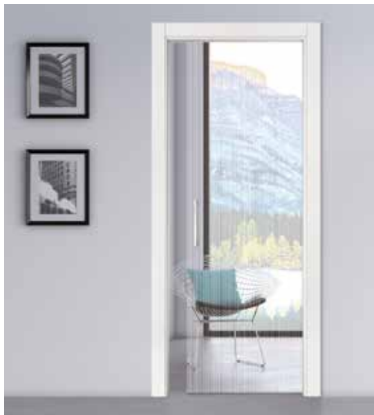
3604 SCORREVOLE A SCOMPARSA, VETRO EXTRA CHIARO, MANIGLIONE CODA CROMO SATINATO