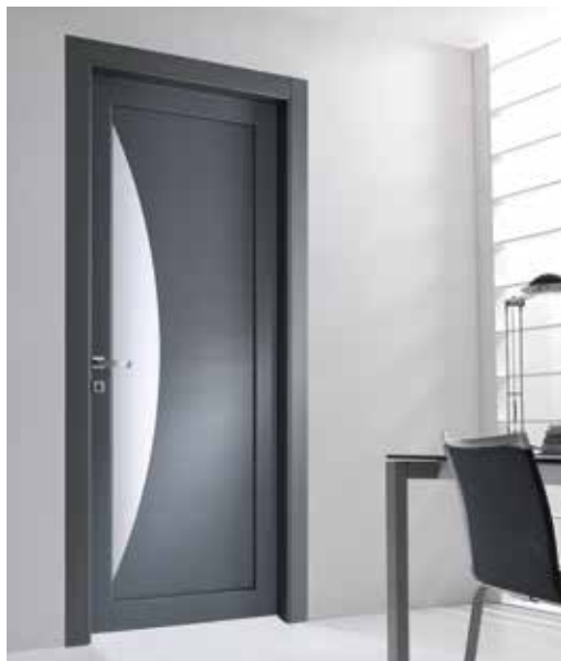
2034 ROVERE PORO APERTO LACCATO PELTRO, MANIGLIA BILBAO CROMO SATINATO