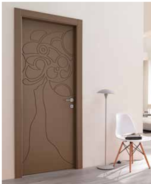
PIANTA LACCATO TABACCO, MANIGLIA TECH CROMO SATINATO