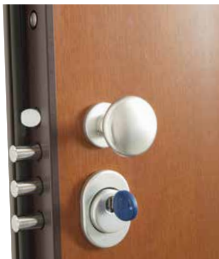
SECUR SERRATURA CON 3 CHIAVISTELLI CILINDRICI, 1 SCROCCO CON MOVIMENTO ORIZZONTALE E PIASTRA DI PROTEZIONE ANTITRAPANO