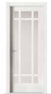
2001 F9 LACCATO BIANCO