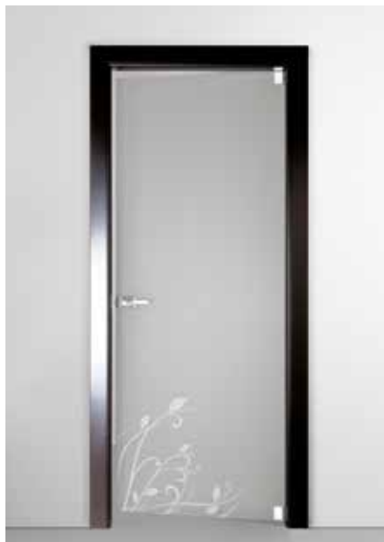
3240 VETRO SATINATO GRIGIO SABBATO TELAIO LACCATO NERO, MANIGLIA CODA CROMO SATINATO