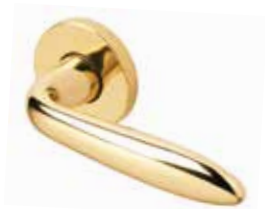
SOFFIO OTTONE LUCIDO