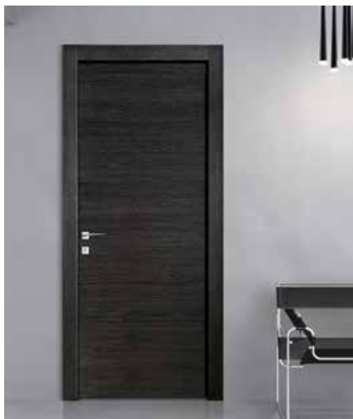
DOGA HORI ROVERE GREY, TELAIO T/SOR+L8, MANIGLIA MONDRIAN CROMO SATINATO