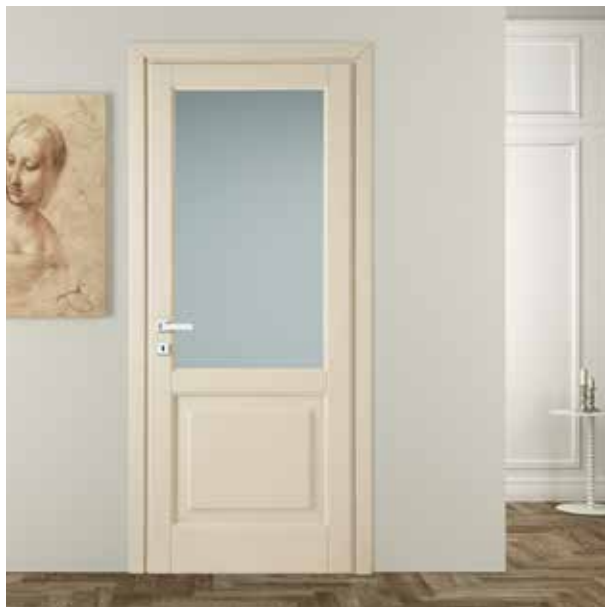
ELECTA SERIE 7 V ROVERE PORO APERTO LACCATO AVORIO, MANIGLIA BILBAO CROMO SATINATO

IL CALORE DI UNA PORTA IN LEGNO, COME LA TRADIZIONE CI INSEGNA, CON LA GARANZIA DI UNA PORTA REALIZZATA UTILIZZANDO LE PIÙ INNOVATIVE TECNOLOGIE: L'USO DEL LEGNO LASTRONATO MINIMIZZA IL NATURALE MOVIMENTO DEL LEGNO, LE FLESSIONI ED EVITA LE FESSURAZIONI. LEGNO MASSICCIO: UN CLASSICO SEMPRE ATTUALE.