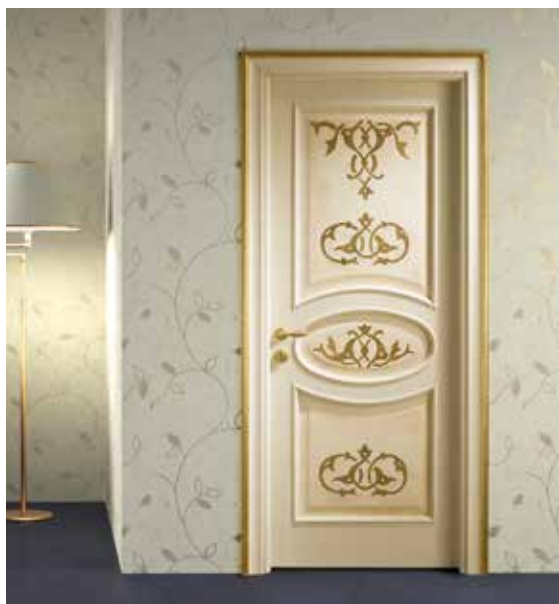
NOVA P LACCATO AVORIO, AFFRESCHI DIPINTI A MANO ARABESQUE , TELAIO CON FILO ORO