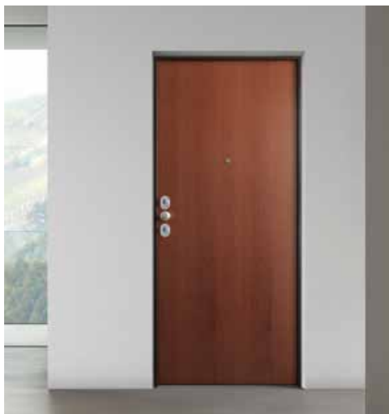
SECUR CS PLUS , RIVESTIMENTO ESTERNO CL, TANGANICA MEDIO, TELAIO E CARTER FINITURA TESTA DI MORO, MANIGLIERIA CROMO SATINATO