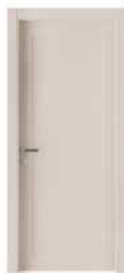
2020 P LACCATO SABBIA