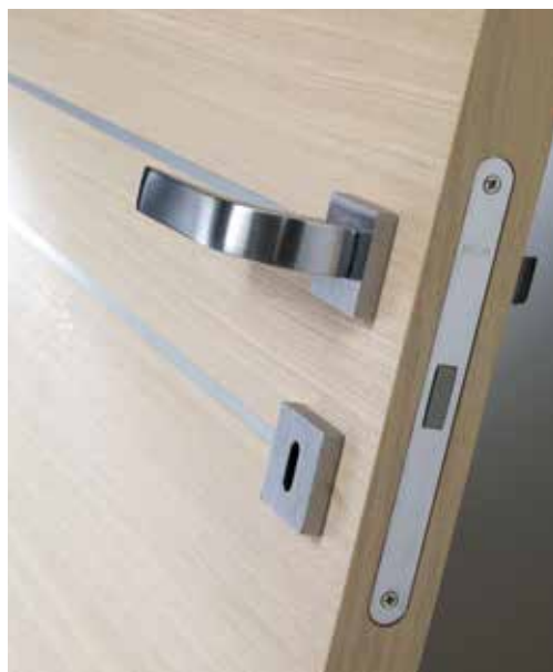
DOGA HORI ALL8 ROVERE SBIANCATO, MANIGLIA NAVY CROMO SATINATO