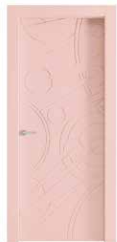
ANDROMEDA LACCATO NCS PANTONE ROSE QUARTZ COLORE DELL'ANNO 2016