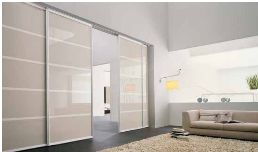
ROLLING MINIMAL , MODELLO FREE, PROFILO ARGENTO, VETRO LACCATO LUCIDO TORTORA SABBBIATO 3223