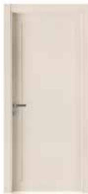
2020 P LACCATO CIPRIA