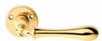
ANTARES OTTONE LUCIDO