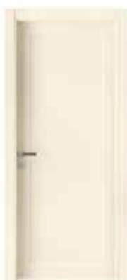
2020 P LACCATO AVORIO