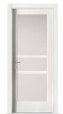
2001 F1 LACCATO BIANCO