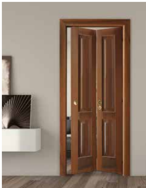
2007 P PIEGO, NOCE NAZIONALE, UNGHIATA L/O TONDA OTTONE LUCIDO