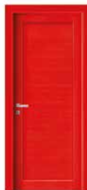
2020 P LACCATO ROSSO