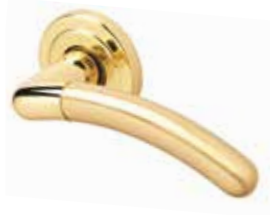
SENNA OTTONE LUCIDO/SATINATO