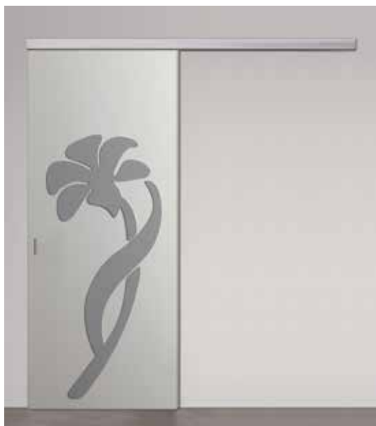
ORCHIDEA SCORREVOLE PLANA, LACCATO SETA, DECORO 3D LACCATO QUARZO, UNGHIATA INKA CROMO SATINATO