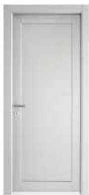
2020 P LACCATO SETA