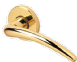
VIRGOLA OTTONE LUCIDO