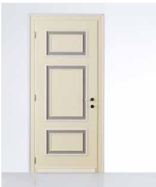
GP33 LIBERTY LACCATO DUE COLORI NCS, CORNICE LACCATO BIANCO, MANIGLIA ATENE OTTONE ANTICO CON CERAMICA BIANCA