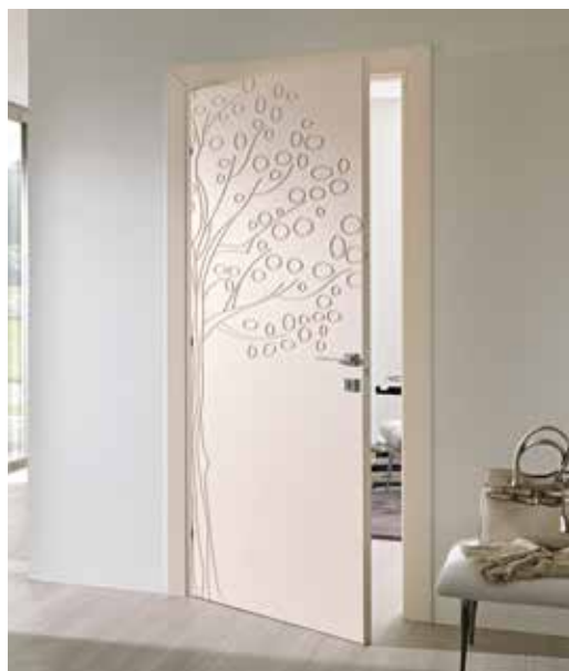
ULIVO LACCATO SABBIA, MANIGLIA TECH CROMO SATINATO