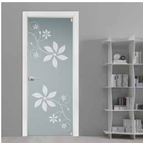
3202 VETRO SATINATO BIANCO SABBATO, TELAIO LACCATO BIANCO, MANIGLIA TIEMPO CROMO SATINATO