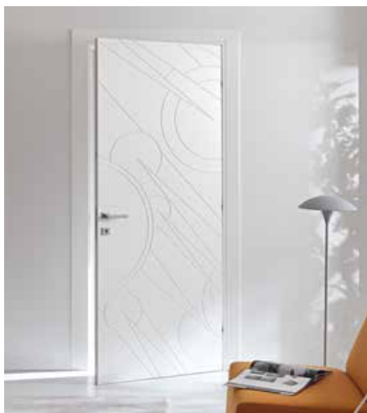
AURIGA LACCATO BIANCO, MANIGLIA BILBAO CROMO SATINATO