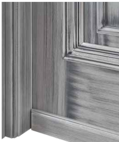
PARTICOLARE DIPINTO FLORENZA, PARTICOLARE FILI ARGENTO IN FOGLIA