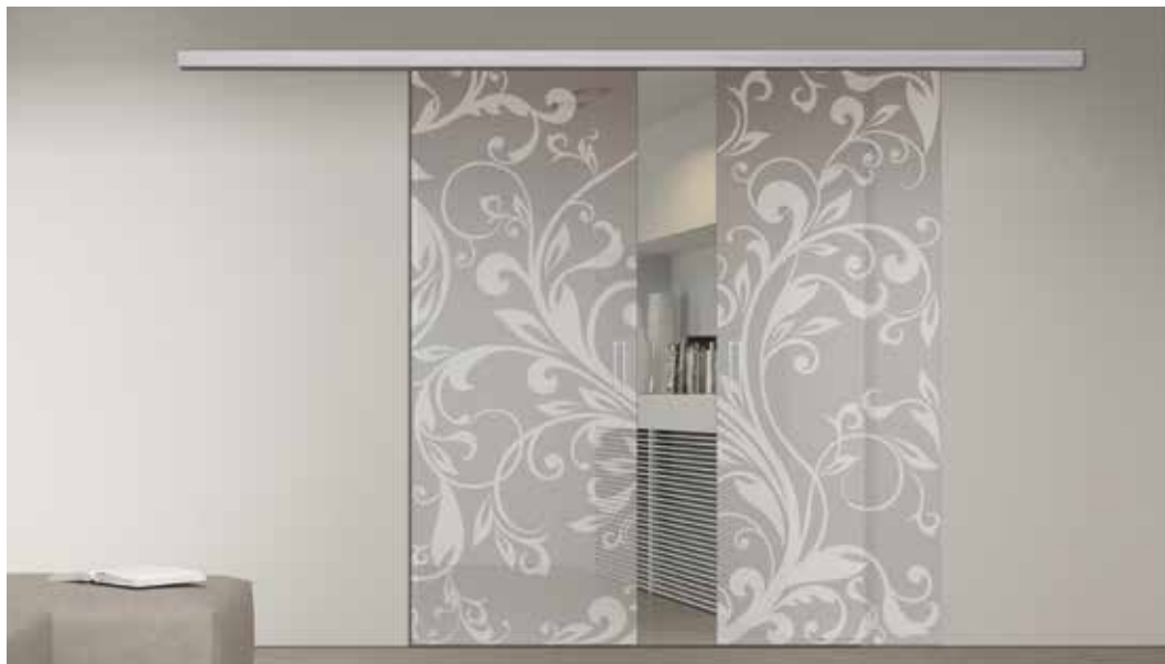
3259 DOPPIA, SCORREVOLE PLANA, VETRO SATINATO BRONZO SABBIAUTO, MANIGLIA SLIDE CROMO SATINATO