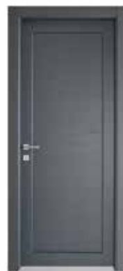
2020 P LACCATO PELTRO