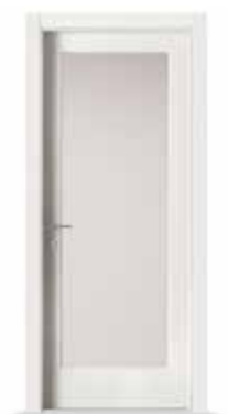
2001 V LACCATO BIANCO