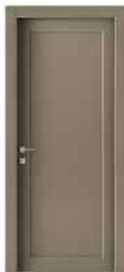
2020 P LACCATO CACAO