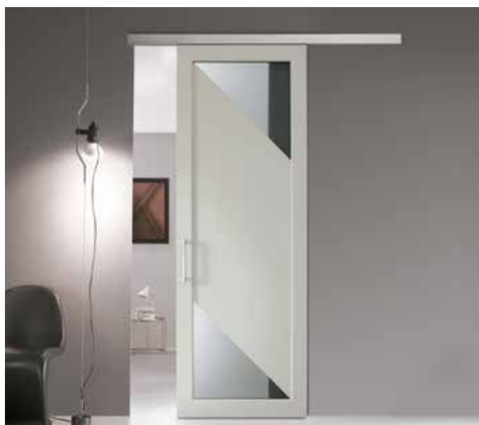
2041 SCORREVOLE PLANA, LACCATO SETA, VETRO SATINATO GRIGIO, MANIGLIONE CODA CROMO SATINATO