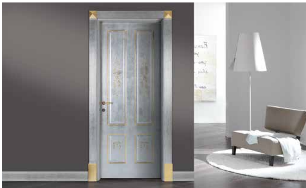
LP40 PANTOGRAFATA, FOGLIA ARGENTO E ORO, DIPINTO SANDY , COPRIFILI DECORATIVI DORICO 5