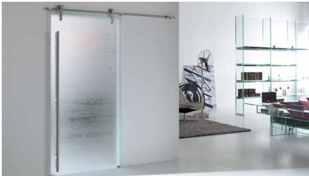
MATERIK VETRO 3701 SU BASE SATINATO BIANCO, SCORREVOLE STEEL, MANIGLIONE TODO CROMO SATINATO