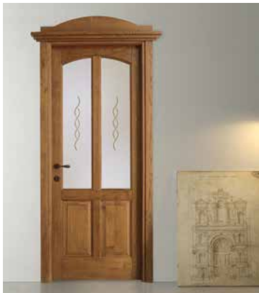
SERIE 4CE V FRASSINO STANDARD, CAPITELLO BARRUECO CON LUNOTTA LISCIA, MANIGLIA ANTARES OTTONE VECCHIO