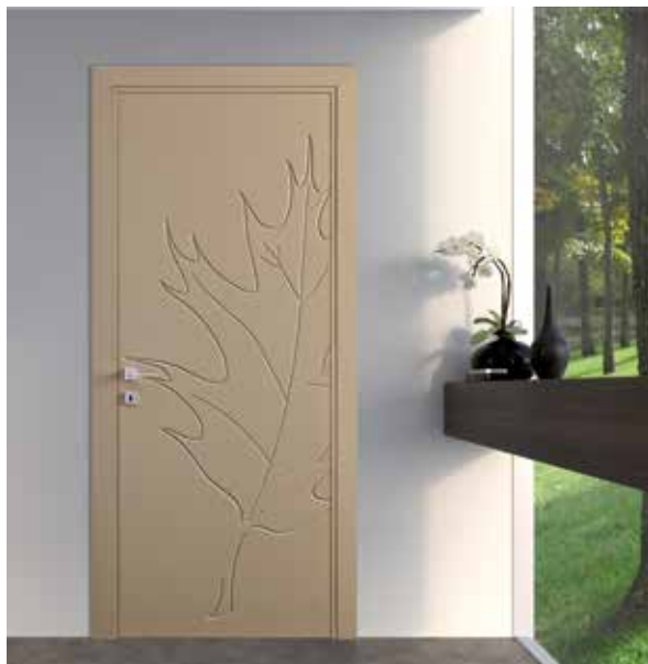
FOGLIA LACCATO TORTORA, MANIGLIA TECH CROMO SATINATO