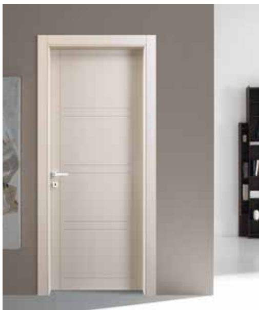
INCISA BP 1038 LACCATO SABBIA, MANIGLIA BILBAO CROMO SATINATO