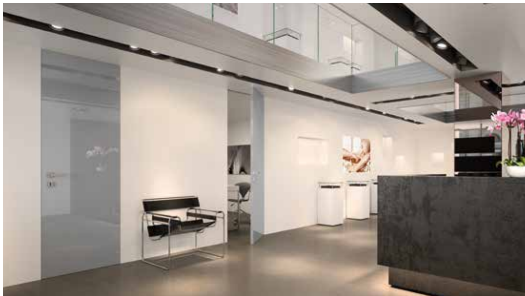
PORTA WALLDOOR CL LACCATA LUCIDA QUARZO, MANIGLIA BILBAO CROMO SATINATO