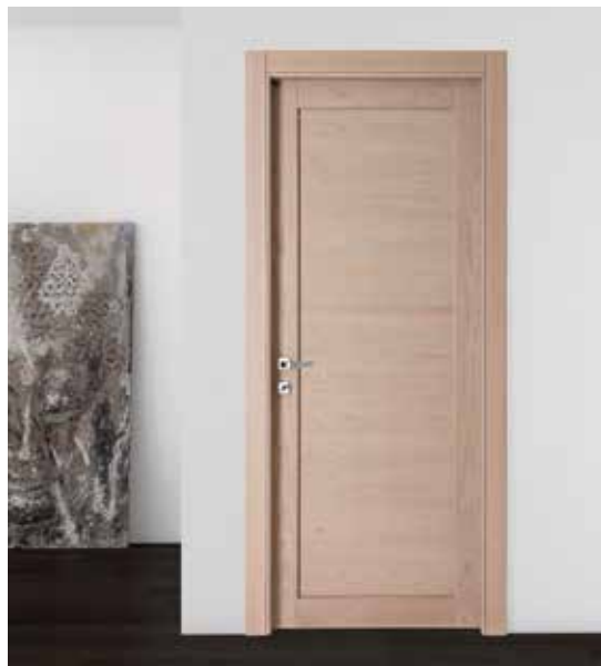
2020 P CILIEGIO LIGHT, MANIGLIA NAVY CROMO SATINATO