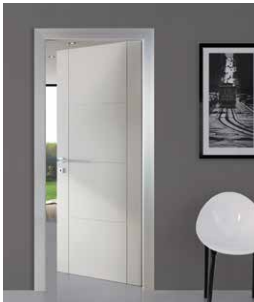
N2 INTAGLIATA, ROVERE PORO APERTO LACCATO SETA, TELAIO TALL, MANIGLIA BILBAO CROMO SATINATO