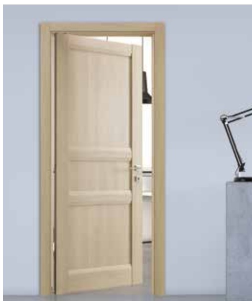
103 P BIDIREZIONALE LARICE , MANIGLIA TECH CROMO SATINATO