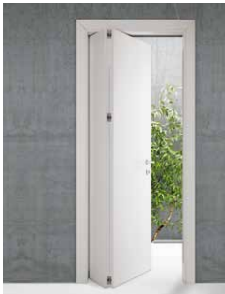
CL DOUBLE' , LACCATO BIANCO, MANIGLIA SPY CROMO LUCIDO