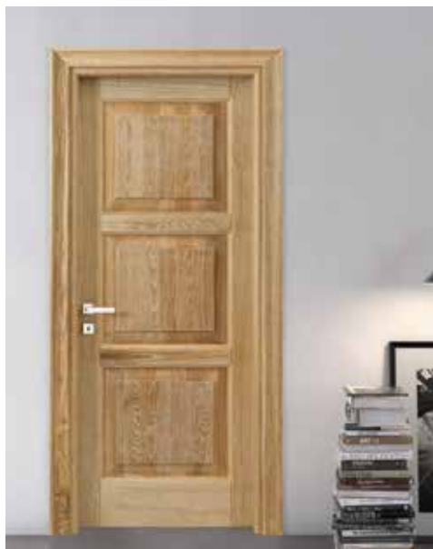
SERIE 3U P ROVERE DECAPE' BIANCO, MANIGLIA BILBAO CROMO SATINATO