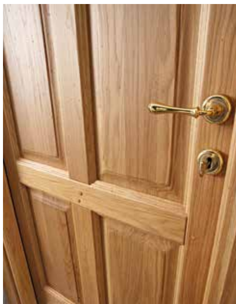
PARTICOLARE SERIE 4P ROVERE MIELE