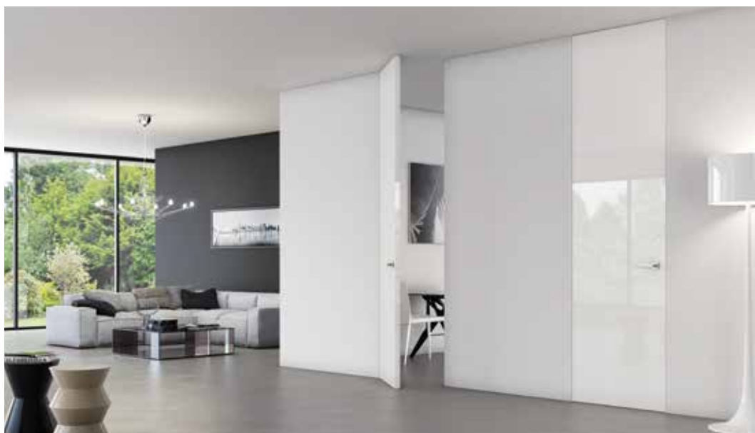
PORTA WALLDOOR CL LACCATA LUCIDA BIANCA, MANIGLIA BILBAO CROMO SATINATO