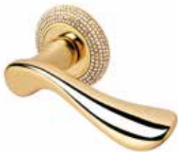
ARMONY CRISTAL OTTONE LUCIDO