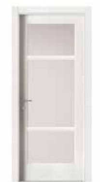
2001 F2 LACCATO BIANCO