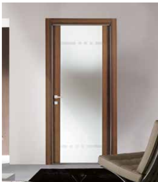
SELESTA 3247 NOCE NAZIONALE, VETRO SATINATO BIANCO SABBIAITO