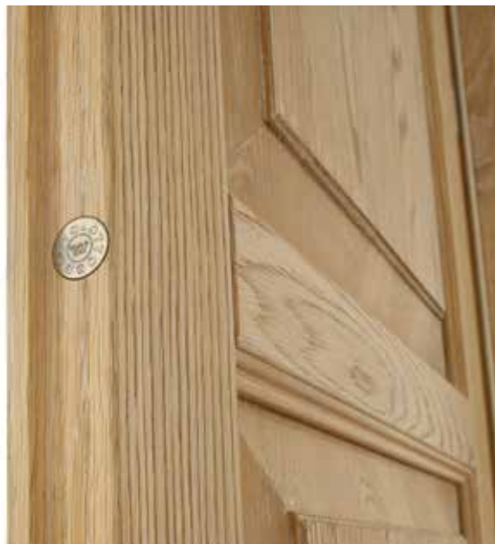
PARTICOLARE DIAMANTATURA RODI