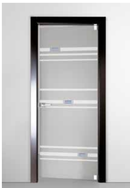
3412 VETRO SATINATO GRIGIO SABBATO CON ACQUERELLI DOPPIA 4068 MANIGLIA TIEMPO CROMO SATINATO