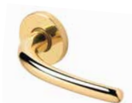
LINEA OTTONE LUCIDO