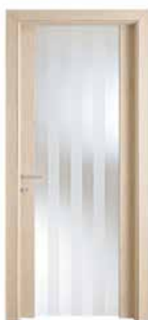
SELESTA 3203 SBIANCATO