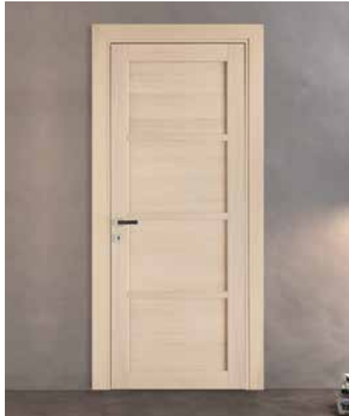
2032 P ROVERE SBIANCATO, MANIGLIA BILBAO CROMO SATINATO