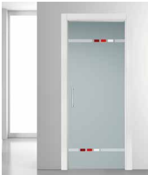
3406 VETRO SATINATO BIANCO SABBATO CON ACQUERELLI DOPPIA 0124, 1122, 1007 SCORREVOLE A SCOMPARSA