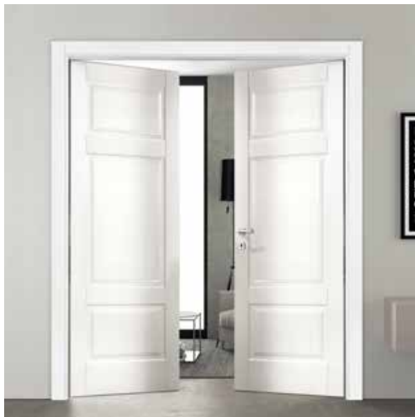
LP33 ANTA DOPPIA, LACCATO BIANCO, TELAIO TR/L8, MANIGLIA ARA CROMO SATINATO