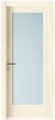
2001 V LACCATO AVORIO