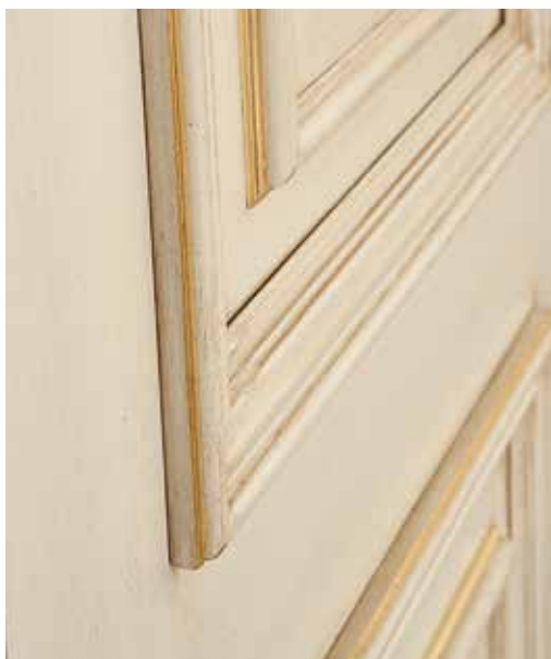
PARTICOLARE CORNICI ALLESTIMENTO PALLADIO