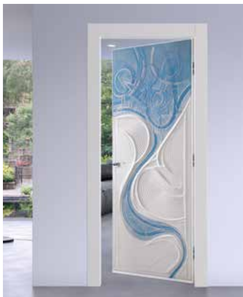
ORDOS TELAIO T/SOR LACCATO BIANCO, MANIGLIA PARROT CROMO LUCIDO/SATINATO