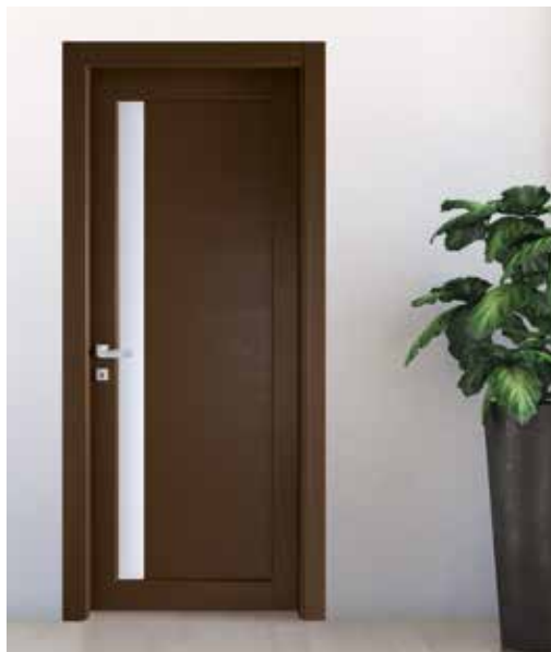
2036 ROVERE PORO APERTO LACCATO RAL, MANIGLIA NAVY CROMO SATINATO