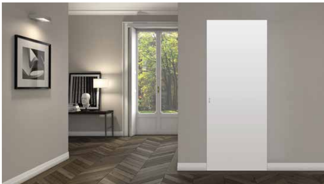
PORTA WALLDOOR CL VERNICIABILE CON PRIMER, MANIGLIETTA TOC CROMO SATINATO