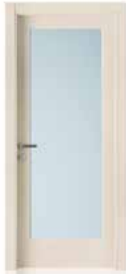
2001 V LACCATO CIPRIA