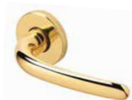
FUTURA OTTONE LUCIDO