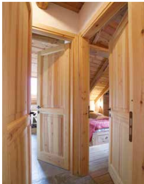
SERIE 13 P PINO NATURALE