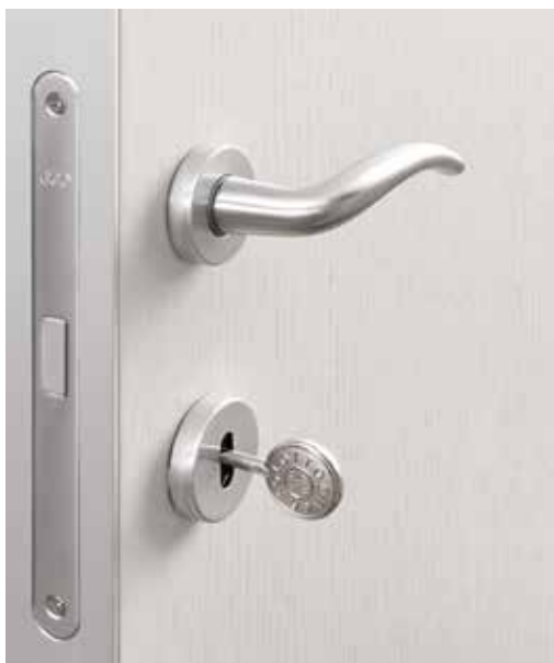
PARTICOLARE ALLESTIMENTO SKY , MANIGLIA VIRGOLA E CHIAVE BERTOLOTTO