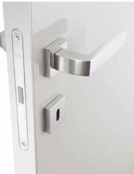
PARTICOLARE ALLESTIMENTO SKY