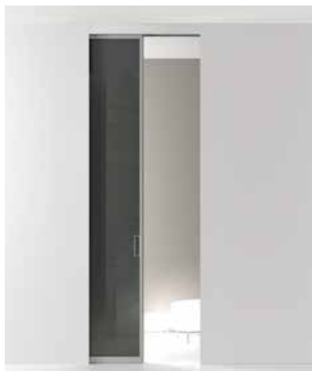
SCORREVOLE WALLDOOR BIKONCEPT INSIDE LUXOR FREE , VETRO LACCATO LUCIDO ANTRACITE, MANIGLIA SLIDE