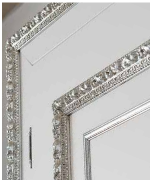
PARTICOLARI ALLESTIMENTO CORNICI ULTRA CLASSIC IN FOGLIA ARGENTO OMBRATO