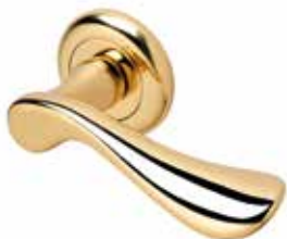
ARMONY OTTONE LUCIDO