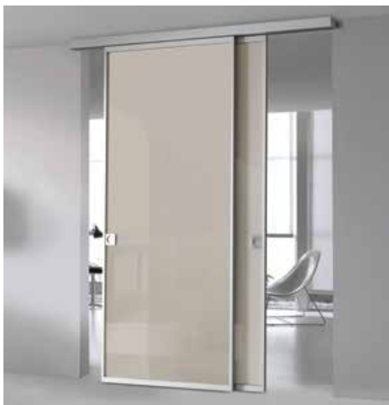
PLANA MEDIUM , MODELLO FREE, PROFILO ARGENTO, VETRO LACCATO LUCIDO TORTORA