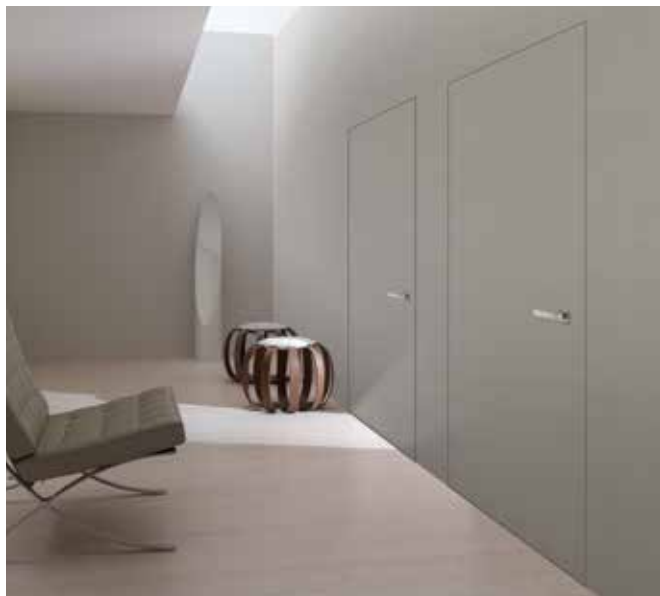
PORTA WALLDOOR CL VERNICIABILE CON PRIMER

LA COMPLANARITÀ DIVENTA PROTAGONISTA. LA PORTA CIECA LISCIA A FILO MURO È VERSATILE E COMPLETA, IDEALE SIA PER MURATURA CHE PER CARTONGESSO. MINIMA È REVERSIBILE, LEGGERA, PER BATTENTI DI SPESSORE 44 MM, REVERSIBILE: DECIDI IN CANTIERE COME MONTARLA. MASSIMA È IMPONENTE, MASSICCIA, CON TELAIO FASCIANTE PER TUTTI GLI SPESSORI PARETE, CON BATTENTE DI SPESSORE 58 MM. WALLDOOR È ANCHE TUTTALTEZZA, LA PORTAMURO SENZA TRAVERSO SUPERIORE. ESSENZIALE. WALLDOOR SI PUÒ COMPLETARE CON LE ANTE DELLE COLLEZIONI BERTELOTTO: FASHION, COSTELLAZIONI, NATURA, VENEZIA PANTOGRAFATO E PANTOQUADRA, 25° BY ARNAUDO.