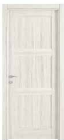
104 P GESSO