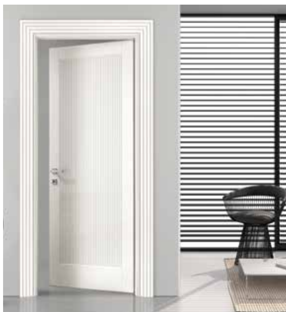
LP54 LACCATO BIANCO, TELAIO T/ONDE, MANIGLIA BILBAO CROMO SATINATO