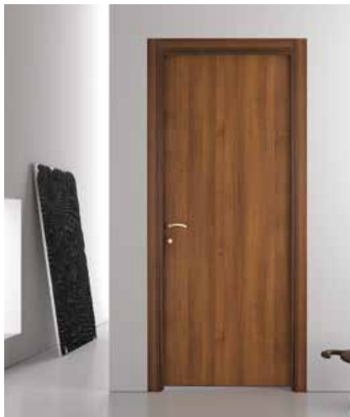
200 NOCE NAZIONALE