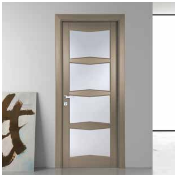
PV47 LACCATO TORTORA, TELAIO TR/L8, VETRO A INFILARE SATINATO BIANCO, MANIGLIA BILBAO CROMO SATINATO