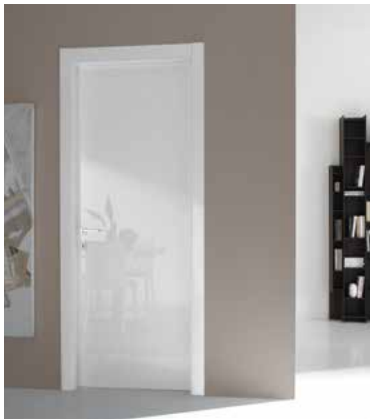
CL SKY ANTA LACCATO BIANCO LUCIDO, TELAIO E COPRIFILI LACCATO OPACO, MANIGLIA CODA CROMO LUC/SAT