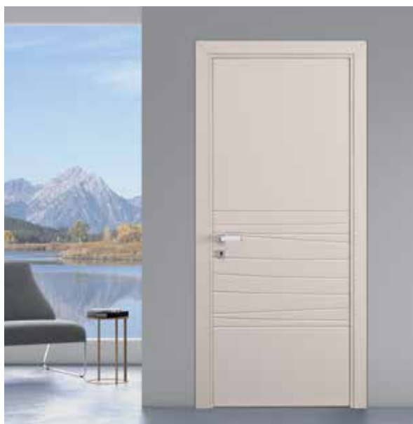
DESERTO LACCATO SABBIA, MANIGLIA GENEVE CROMO SATINATO

NATURA È IL TERMINE CHE DESCRIVE L'INSIEME DEGLI ESSERI VIVENTI E INANIMATI, NELLA TOTALITÀ DEI FENOMENI E DELLE FORZE CHE IN ESSO SI MANIFESTANO. LE NUOVE PORTE LACCATE, INCISE O PANTOGRAFATE, PRENDONO SPUNTO DA FIORI, ALBERI, FOGLIE, ELEMENTI NATURALI. DISEGNI STILIZZATI CONIUGANO LA TRADIZIONE DI UN DECORO CHE DA SEMPRE ISPIRA L'ARTE E IL DESIGN CON UNA LACCATURA OPACA O LUCIDA IN TUTTA LA GAMMA DEI COLORI BERTOLOTTO, RAL E NCS.