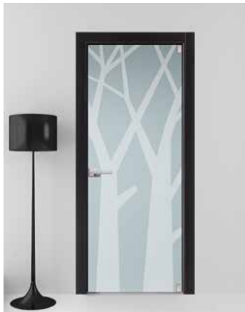
3258 LACCATO RAL, VETRO SATINATO SABBIATO, MANIGLIA TIEMPO CROMO SATINATO