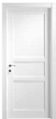
103 P BLANK