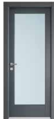
2001 V LACCATO PELTRO