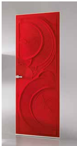
MAKAN PORTA WALLDOOR