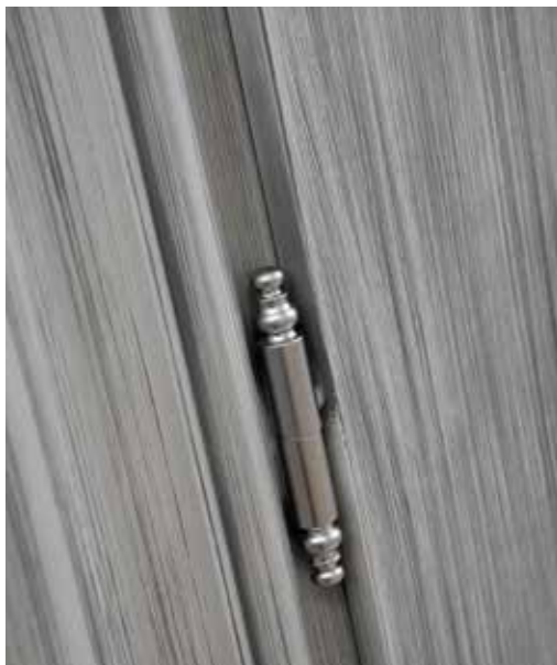
GP1 PALLADIO LACCATO AVORIO PATINATO GRIGIO, CORNICE FILO ARGENTO, DISEGNO FLORENZA ARGENTO ANTICO, MANIGLIA ARA CROMO SATINATO