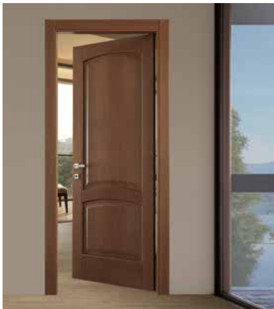
2013 P ROVERE NOCE, MANIGLIA GENEVE CROMO LUC./SAT.