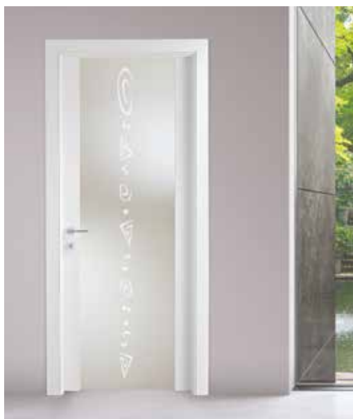
SELESTA 3239 BLANK , VETRO SATINATO SABBIATO, MANIGLIA CAROL CROMO SATINATO