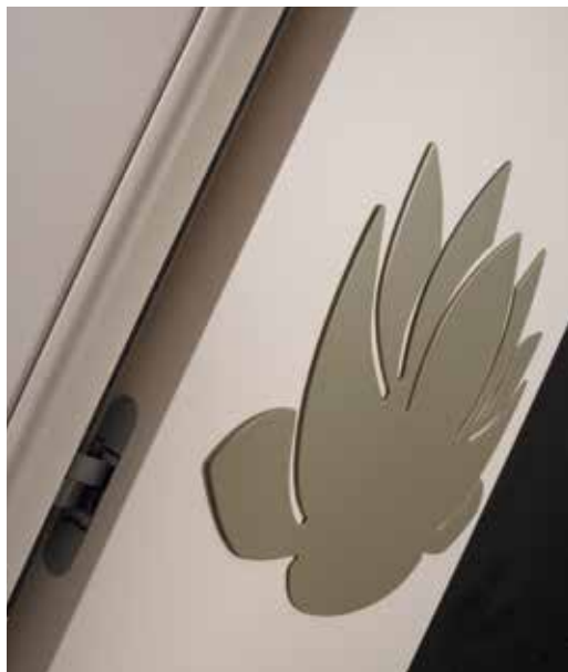
NINFEA LACCATO SABBIA, DECORO 3D LACCATO CACAO, TELAIO T/SOR +L8, MANIGLIA BILBAO CROMO SATINATO