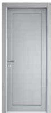
2020 P LACCATO ACCIAIO