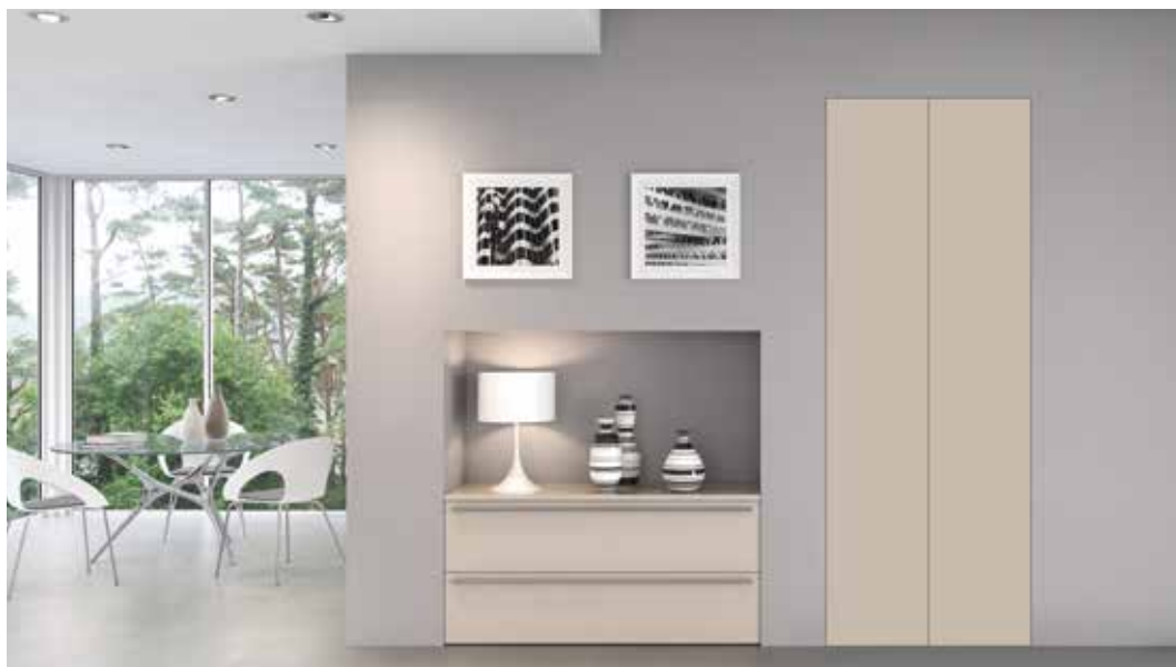
ARMADIO WALLDOOR ANTA DOPPIA LACCATA RAL