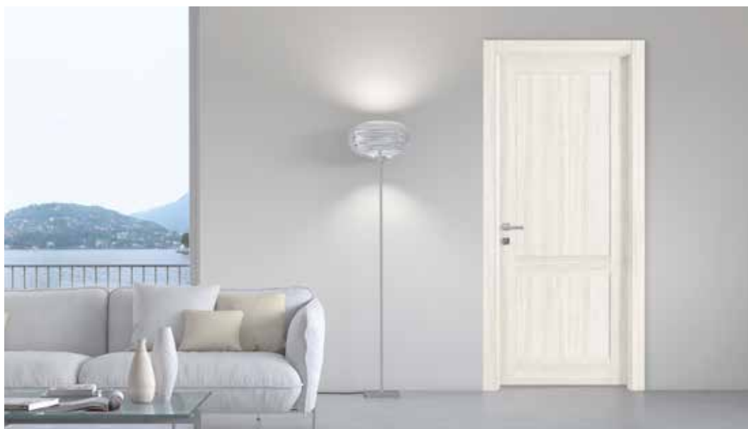
102 P GESSO, MANIGLIA BILBAO CROMO SATINATO