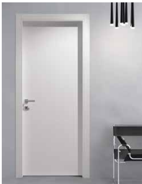
MATERIK BIANCO, TELAIO TSUB/LSUB69, MANIGLIA BILBAO CROMO SATINATO