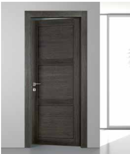
2044 P ROVERE GREY, MANIGLIA MONDRIAN CROMO SATINATO