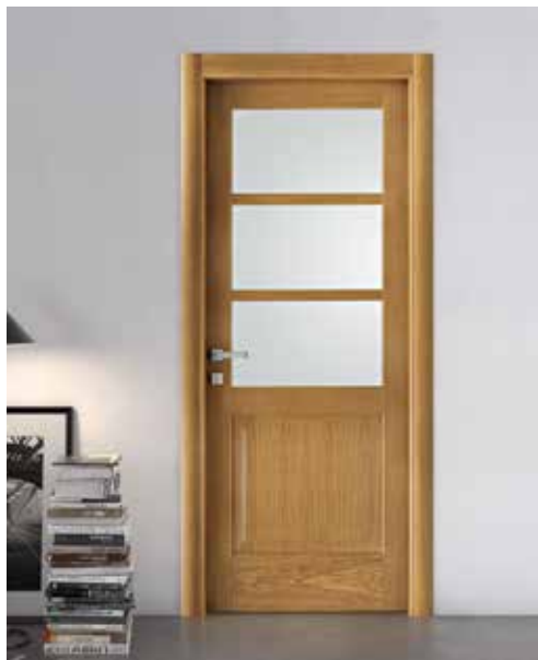
2007 F3 ROVERE MIELE, VETRO SATINATO BIANCO, MANIGLIA BILBAO CROMO SATINATO